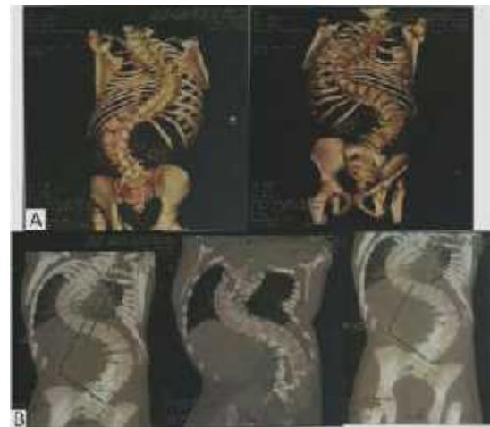
Gambar 5. CT-Scan keseluruhan tulang belakang: (A) 3-D reconstruction , (B) Coronal view

Computed Tomography Scan (CT-Scan) keseluruhan tulang belakang dilakukan untuk menyingkirkan adanya kemungkinan cacat kongenital.