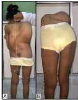
Gambar 2. (A) Plumb line bergeser 2,5 cm dari celah gluteal, (B) Tes Adam forward bending memperjelas punuk torakal dan torakolumbal

3,0 cm dari celah gluteal. Test Adam forward bending menunjukkan punuk torakal dan torakolumbal menjadi lebih jelas. Pada inspeksi dari anterior, posterior dan lateral kanan kiri tidak didapatkan bercak Café au lait .