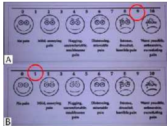
Gambar 10. Skala Analog Visual, (A) sebelum operasi, (B) sesudah operasi

Selain besarnya kurva, dilakukan evaluasi skala analog visual dengan membandingkan nyeri sebelum dan sesudah operasi.