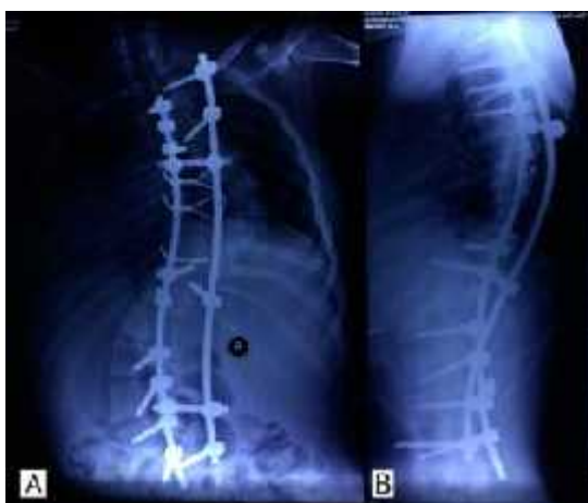
Gambar 9. Radiologi post koreksi skoliosis, (A) Tampak AP, (B) Tampak lateral