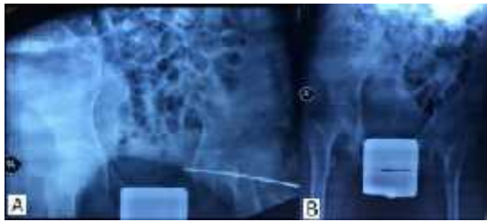
Gambar 7. (A) Reduksi dan fiksasi dislokasi panggul bawaan, (B) radiologi Post removal K-Wire

Tidak didapatkan subluksasi lensa pada pemeriksaan mata dan ekokardigrafi dalam batas normal. Namun pada pemeriksaan spirometri menginterpretasikan Restrictive Impairment tanpa obstruksi.