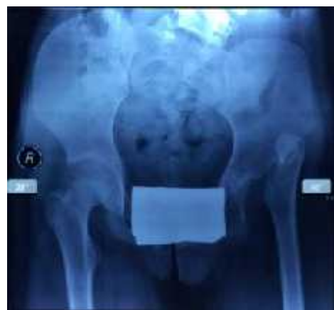
Gambar 6. Radiologi pelvis tampak AP, menunjukkan dislokasi panggul bawaan, dengan sudut asetabulum kiri 40^\circ dan kanan 28^\circ

Pada foto polos pelvis tampak AP didapatkan dislokasi panggul bawaan pada panggul kiri dengan sudut asetabulum sebesar 40^\circ . Telah dilakukan reduksi terbuka dislokasi panggul bawaan, fiksasi menggunakan K-Wire (Pining) , diikuti dengan periode imobilisasi hemispica Cast .