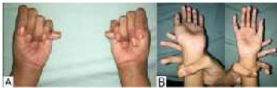
Gambar 3. Tes khusus: (A) Thumb (Steinberg) sign , (B) Wrist (Walker) sign

Tes khusus untuk evaluasi sindrom Marfan meliputi Thumb (Steinberg) sign dan Wrist (Walker) sign didapatkan hasil positif pada keduanya.