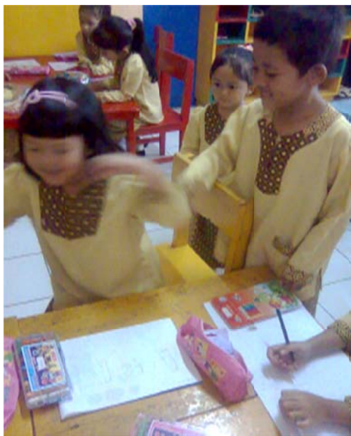
Gambar 2. Anak mengganggu temannya yang sedang menggambar

Perilaku anak dapat memberikan pujian pada saat temannya mengerjakan pekerjaan dengan rapi, jarang dilakukan sebagian anak (empat orang), kadang-kadang dilakukan sebagian anak (empat orang), dan tidak pernah dilakukan oleh sebagian anak (empat orang). Serta perilaku anak dapat menghargai hasil karya temannya jarang dilakukan oleh sebagian anak (delapan orang), kadang-kadang dilakukan oleh sebagian anak (tiga orang) dan tidak pernah dilakukan oleh sebagian anak (satu orang). Perilaku ini dapat terlihat pada kegiatan mewarnai ada anak yang mengejek hasil pekerjaan temannya dan berkata “ ah bikinan kamu mah acak-acakan” dan pada saat anak yang mengerjakan hasil karya anak malah di coret-corek sambil berkata “ uh jelek “.