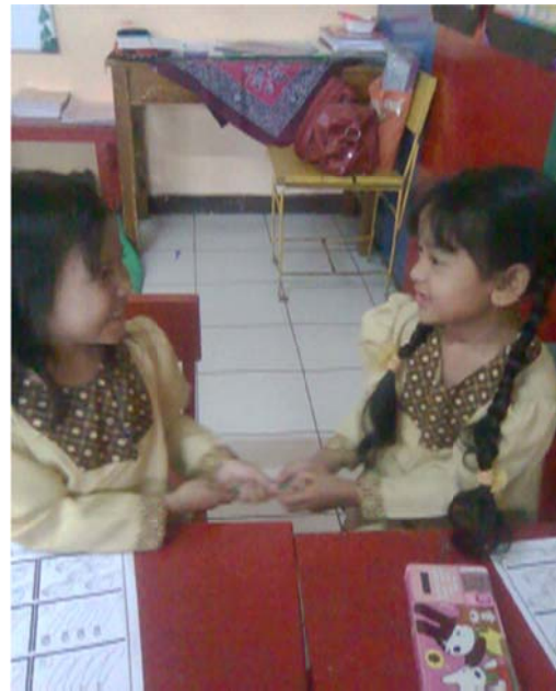
Gambar 1. Anak tidak mau meminjamkan pensil warna

dipakai temannya sehingga mereka rebutan pensil warna dan pada kegiatan sedang menulis ada anak yang pensilnya sudah kecil anak tersebut ingin meminjam pensil pada temannya tapi tidak ada temannya tidak mau meminjamkannya.