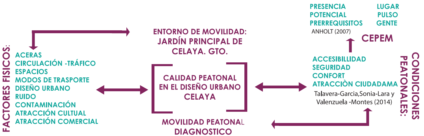
Figura 3. Metodología de Caracterización Peatonal de Entornos de Movilidad.