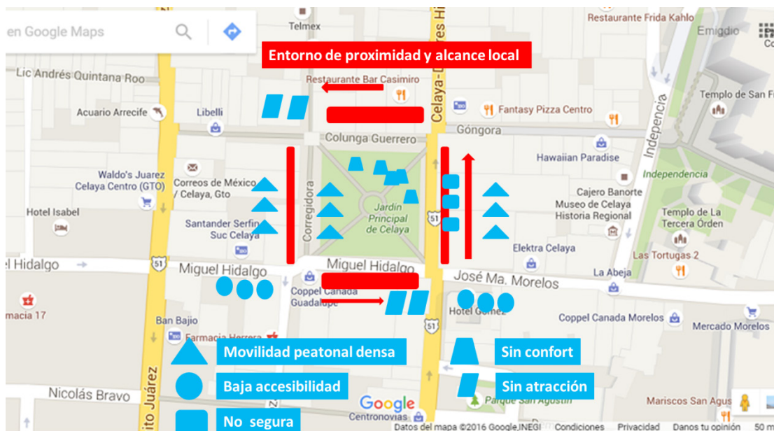
Figura 3. Calidad de Movilidad Peatonal en Celaya, Gto.

- Asimismo, respecto a la atracción consideran que se puede mejorar las fachadas y los espacios verdes, jardinerías y el mobiliario urbano, aunque la zona arbolada es de reconocimiento y orgullo para ellos. Consideran que el ruido-contaminación es natural de la zona, siendo baja sin problemas de calidad, pero dañina para los visitantes, debido a los constantes sonidos de cantantes callejeros, automovilistas sin educación al sonar sus claxon y el ruido natural de los comerciantes al ofrecer sus productos.