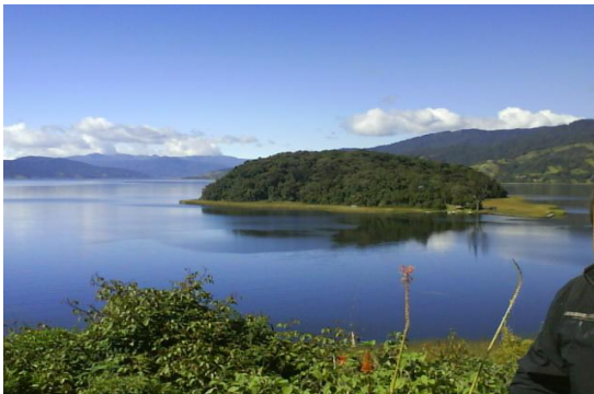
Foto 1. Panorámica del Humedal Ramsar Laguna de La Cocha

La presente investigación se realizó en la vereda de Santa Rosa del Corregimiento El Encano, Laguna de la Cocha, Colombia. Este sitio es catalogado como Humedal Ramsar de importancia internacional, está ubicada a 2750 m de altitud, con temperatura promedio de 9°C y con alta humedad relativa (Foto 1).