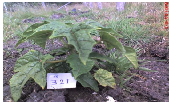
Foto 2. Establecimiento Modelo alternativo de V. cundinamarzensis + kikuyo, Santa Rosa, Humedal Laguna de La Cocha, Fuente: Carmen L. Galviz

Las Figuras 2 y 3 muestran el establecimiento de algunos de los modelos evaluados.