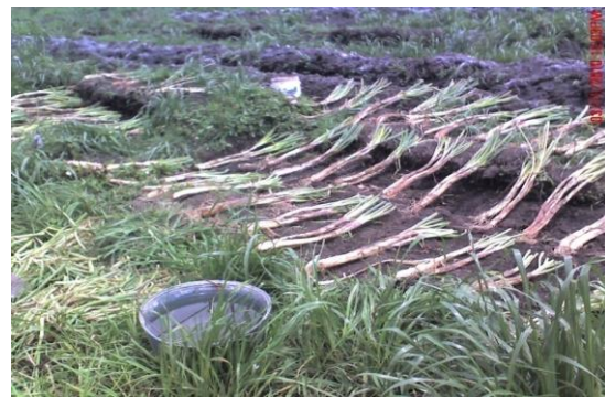
Figura 3. Establecimiento Modelo alternativo de V. cundinamarzensis + cebolla, Santa Rosa, Humedal Laguna de La Cocha, Fuente: Carmen L. Galviz