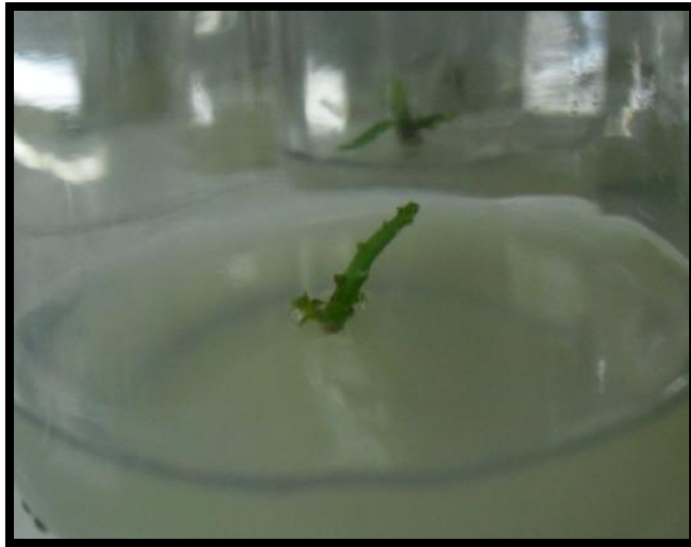
Figura 1. Crecimiento de los segmentos nodales de Hylocereus magalanthus en a) Medio MS sin suplementos adicionales (control) b) Medio MS suplementado con BAP a 0,5 mg/l

se observa en la Figura 2. Por otro lado, el tratamiento que mostró los peores resultados fue el número 4, con una media de 10,50 mm; valor que también mostró diferencias significativas según LSD (Tabla 1). Los únicos estudios realizados en Hylocereus magalanthus que utilizaron BAP y Kin como citoquininas fueron Suárez et al. (2014) y Caetano et al. (2014), en donde el primero utilizó las dos citoquininas combinadas y por tanto no es posible hacer comparaciones. Por otro lado, con Caetano et al. (2014), se confirman los resultados de este estudio, ya que reportaron un menor número de brotes con el tratamiento suplementado con Kin. Sin embargo, concentraciones más altas de BAP en relación a las probadas en este estudio, podrían mejorar la elongación y el crecimiento de los brotes de acuerdo con lo reportado por Viñas et al. (2012) para Hylocereus costarricensis .