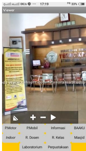
Gambar 5. Tampilan Menu Fasilitas

Tampilan ini menampilkan fasilitas-fasilitas Perguruan Tinggi Teknokrat dalam bentuk objek Panorama. Pada tampilan ini, user dapat memilih fasilitas yang diinginkan untuk dilihat terlebih dahulu dengan menekan tombol yang telah disediakan