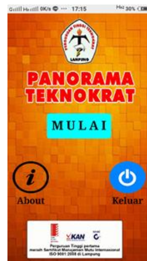
Gambar 3. Tampilan Menu Awal

Pada gambar berikut ini adalah tampilan awal dari aplikasi Pengenalan Fasilitas Perguruan Tinggi. Tampilan awal ini memiliki 3 tombol yaitu tombol “Mulai”, tombol “Tentang” dan tombol “Keluar”.