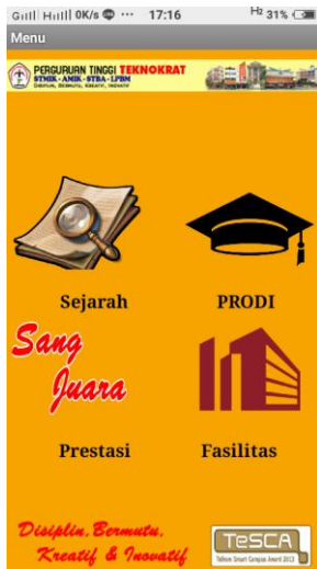
Gambar 4. Tampilan Menu Utama