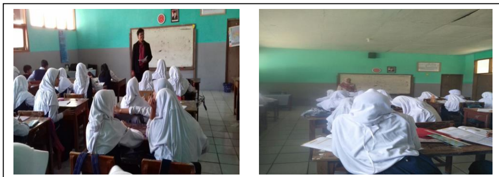
Gambar 2. Suasana Belajar Kelas yang Menggunakan Pembelajaran Ekspositori

Berbeda dengan kelas yang menggunakan pembelajaran biasa karena pada kelas kontrol siswa terbiasa menerima penjelasan dari guru sehingga siswa besar kemungkinan mengalami kesulitan jika tidak mendapat bantuan dari guru. Untuk keaktifan berdiskusi kelompok siswa kelas eksperimen sebagian besar kelompok berdiskusi dengan aktif, sedangkan pada kelas kontrol hanya sebagian kecil kelompok yang berdiskusi dengan aktif dan interaktif. Pada Gambar 2 karakteristik pembelajaran konvensional membuat suasana kelas cenderung bosan, siswa selalu mengerjakan prosedur dan langkah pengerjaan sesuai contoh-contoh yang diberikan oleh guru, dan tidak adanya proses diskusi sehingga siswa yang belum paham mengenai apa yang sedang dipelajari takut bertanya dan bahkan cenderung membiarkan ketidak pahaman-nya dikarenakan tidak adanya kesempatan untuk bertanya maupun berdiskusi. Sejalan dengan Hiebert, dkk. (Aripin & Purwasih, 2017). Bukti menunjukkan jika siswa belajar dengan mengingat dan latihan prosedural, mereka akan kesulitan dalam memperoleh tes konsep konsep matematika secara mendalam. Hal tersebut terlihat pada Gambar 2 berikut ini.