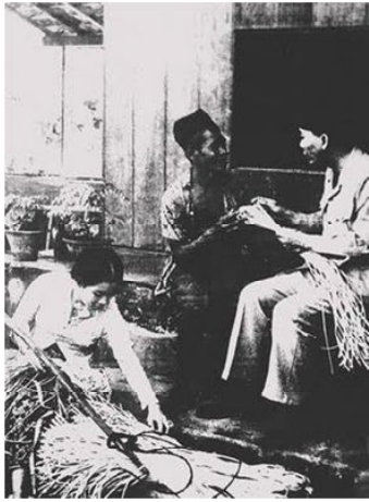
Gambar 3. Ir. Soekarno dan Fatmawati Mengunjungi rakyat.

Peci yang digunakan rakyat kebanyakan seperti terlihat dalam gambar di atas adalah sumber inspirasi Soekarno dalam menyebarkan nasionalisme, ia menyamakan dirinya dengan mereka. Nasionalisme yang dipegang teguh oleh Soekarno adalah karena rakyat Indonesia sendiri seperti itu mereka berbuat, menghasilkan dan diperuntukkan untuk lingkungan mereka sendiri tanpa menggantungkan pada orang lain, dan lebih terpenting adalah nilai ibadah tetap mereka junjung tinggi dengan tanpa melupakan nilai syukur pada Allah SWT. Ada nilai sejarah dalam penggunaan simbol rakyat dengan penggunaan nama “Marhaen” oleh Soekarno, nama ini bukan nama orang dari Eropa Barat pada jaman pergerakan dulu yang cenderung berpaham Sosialis ataupun Komunis, nama Marhaen adalah nama orang Jawa Barat, yang ditemui oleh Soekarno pada tahun 1920an ketika beliau kuliah di THS (ITB sekarang), seperti cerita yang diambil dari Pena Soekarno,