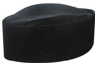
Gambar 1. Peci hitam dikenal dengan Kopiah

Peci, merupakan istilah lain dari penutup kepala yang sering digunakan oleh seorang pria muslim untuk acara-acara keagamaan maupun acara resmi lainnya. Peci sebagai sebuah penutup kepala bagi umat Islam di Indonesia menjadi sebuah sejarah panjang, dari sebuah nilai keagamaan menjadi sebuah nilai ideologi berbangsa. Peci memasuki wilayah pemikiran simbolis para pemimpin Indonesia dalam sejarah perjalanan bangsa. Bagaimana sebuah Peci menjadi sebuah “Visual bergerak” untuk melambangkan bahwa pemakaiannya adalah seorang pemimpin yang nasionalis sekaligus agamis, khususnya Soekarno sebagai pencetus lahirnya Pancasila dan yang mempopulerkan peci sebagai simbol nasionalisme, menjadikan peci menjadi sebuah hal yang sangat menarik. Sangat menarik memang mengambil hubungan antara sebuah peci dengan Pancasila yang memiliki lima sila sebagai dasar negara RI. Diawali dengan cerita bagaimana sebuah peci hadir didalam masyarakat Indonesia dan juga cerita sejarah pertamakali Soekarno sebagai pemimpin bangsa ingin menjadikan peci sebagai identitas nasional, lalu dihubungkan dengan Pancasila sebagai dasar negara Indonesia. Apa arti sebuah peci dengan nilai-nilai yang terkandung dalam Pancasila, bagaimana sebuah peci bermakna mendalam pada sebuah ideologi bangsa? Keinginan ingin membuka sebuah semiotik semantik dalam perkara peci sebagai penutup kepala sangatlah menggelitik untuk dikaji.