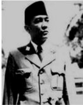
Gambar 2. Ir. Soekarno menggunakan Peci hitam ketika menjadi Presiden RI I

terjadi pada peci, Soekarno menggunakan peci hitam sebagai rasa nasionalismenya pada tanah air pengguna sesudahnya pun merasakan hal yang sama ketika mereka menggunakan peci hitam ketika tampil di muka umum.