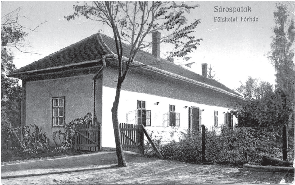
4. ábra. A régi főiskolai kórház (képes levelezőlap az 1920-as évekből)

Az öreg, 18 ágyas kórház egyre inkább kicsinek bizonyult. Az évek során mind határozottabban fogalmazódott meg egy modern, korszerű intézmény létesítésének igénye. Ennek eredményeként jött létre és nyílt meg 1937 szeptemberében a Kazinczy utcai új iskolakórház, hivatalos nevén a Sárospataki Református Főiskola Ifjúsági Kórháza.