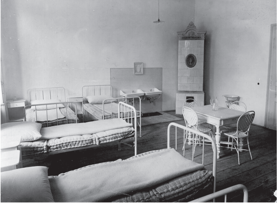
6. ábra. Kórterem-részlet az 1930-as évek végéről

Van a diákoknak már egy jó doktora, Aki a beteget mindég vigasztalja. Vigasztalás mellett szépen megvizsgálja, Megnézi pontosan, milyen nagy a láza. És úgy beszél aztán a diák-emberrel, Mint az apa szokott a kedves gyermekkel, Mondja néki, hogy csak jól viselje magát, Tartsa be mindenkor az ő jó mondását. Akkor hamar javul, kimegy nemsokára, És köszönhet nagyot, hogy „Alászolgája”!