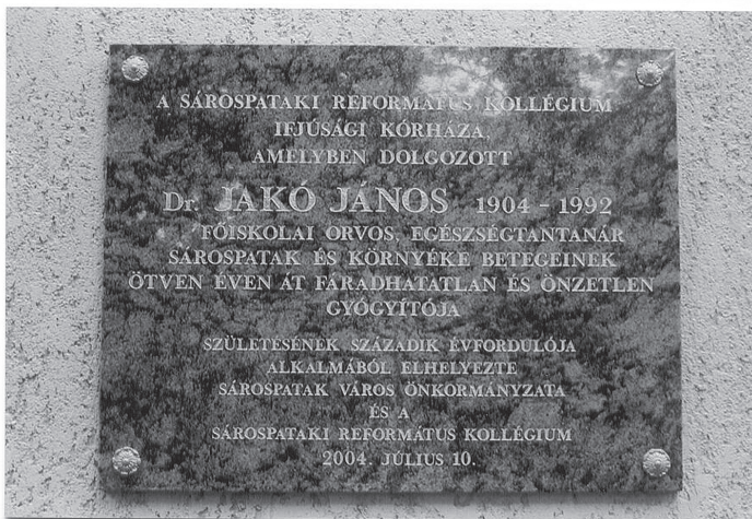
8. ábra. Emléktábla a volt Főiskolai Kórház falán (fent), az emléktábla közelebbről (lent)