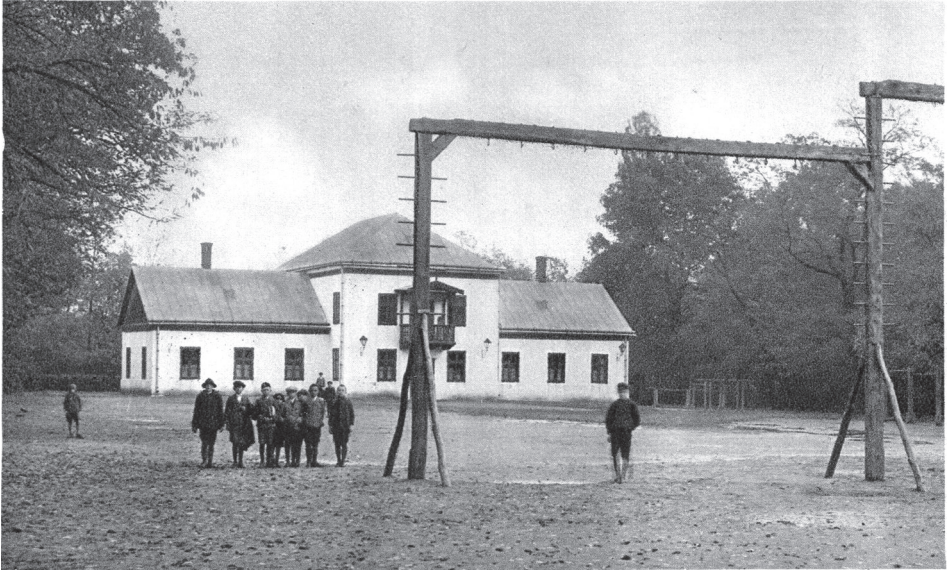
1. ábra. A Tornacsarnok (képes levelezőlap 1927-ből)

1859-ben Mudrány András alapítványából megnyílt a Tápintézet, közismert nevén a „konviktus”, ami szakszerű vezetés és iskolaorvosi felügyelete mellett a Kollégium tanulóifjúságának egészséges étkeztetését szolgálta.