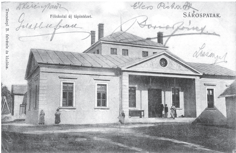
2. ábra. A Tápintézet (1913-ban feladott képes levelezőlap)

1859-ben Mudrány András alapítványából megnyílt a Tápintézet, közismert nevén a „konviktus”, ami szakszerű vezetés és iskolaorvosi felügyelete mellett a Kollégium tanulóifjúságának egészséges étkeztetését szolgálta.