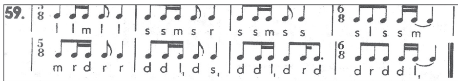
2. ábra. Kodály Zoltán: Ötfokú zene 4. kötet/ 59 gyakorlat

A tanulók második feladatként a Kodály Zoltán által gyűjtött betűkottával lejegyzett dallamot szólaltatták meg az Ötfokú Zene 4. kötetéből. Kodálynak a rokon népek zenéje megismertetését szolgáló elveinek megfelelően a negyedik kötetben ötvenhét cseremis és három finn népdalfeldolgozás szerepel. Rokon népeink dalai ritmikailag gazdagabbak, mint a magyar népdalok, ezért remek lehetőséget nyújtanak a diákok ritmuskészségének fejlesztésére. A negyedik füzetben a magyar népdaltól idegen, sűrűn váltakozó ütemmutatókat találunk, mint ahogy ennél a nyolc ütemes lá-pentaton hangkészletű, lefelé kvintváltó példánál is, ahol 5/8 és 6/8 metrumok váltakoznak.