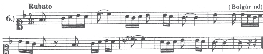
4. ábra. C-kulcsban lejegyzett kottapélda

A C-szopránkulcsban lejegyzett különleges, 7/16-os metrumú, 11 ütemes bolgár népdal összetettebb ritmusértékeket, átkötéseket tartalmaz, ugyanakkor kerüli a nagyobb hangközöket.