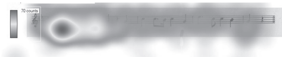
7. ábra. Kodály Zoltán: Jézus és a kufárok című kórusművének valamennyi tanulóval készült hőtérképe

A Kodály Zoltán által komponált kórusmű kottáján kivehető, hogy a nyitó ütem kiszűrt ritmikáin, illetve a fellépő tiszta kvint hangközlépesen történt hosszabb fixáció. A részlet a továbbiakban nem okozott nehézséget a tanulóknak.