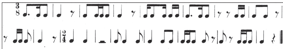
1. ábra. Ritmuspélda

A tanulók elsőként a számítógép monitorján megjelenő összetettebb ritmusképleteket tartalmazó, 17 ütemes példát ritmizálták a rövid áttekintés után. A példára jellemző a váltakozó ütemmutató (3/8, illetve 2/4), a példa első tíz üteme páratlan, következő hét üteme páros metrumú.