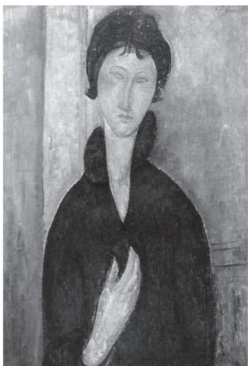
Modigliani: Kék szemű nő (1917)

Nézd meg figyelmesen az alábbi képeket, majd írd szabadon az egyik kép és valamelyik olvasott szöveg kapcsán! Írd le bátran minden gondolatot, érzést, véleményt, amit csak az alkotások előhívtak belőled – csak a saját magad számára írod!