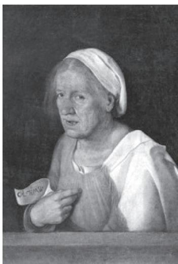
Giorgione: Idős hölgy portréja (1505)