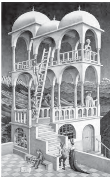
Figura 10: M. C. Escher, Belveder , 1958

Retornemos ao anúncio Perspective da Lexus. O carro pára no ponto em que se gera a ilusão. Um ser em pedaços mostra-se inteiro. Suspenso no ar, parece, agora, integrar um plano bidimensional. Parado, elevado, estampado, a posar para a eternidade, faz lembrar um ícone da arte (copta, bizantina, pop art ou outra). Estes traços configuram uma representação que se situa nos antípodas da perspectiva.