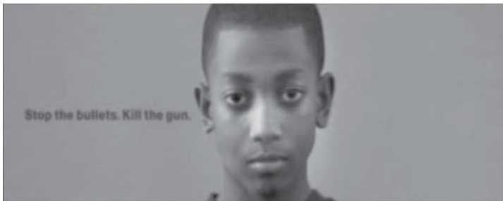
Figura 4: Stop The Bullet , Choice FM Radio, 2007

Os anúncios Burst 28 , da Schweppes (Figura 3), e Ballet 29 , da NFL Company in USA, contam-se entre aqueles em que o efeito estético da câmara lenta mais sobressai, a partir de motivos deveras simples: no primeiro, a explosão, em vários cenários, de balões cheios de água; no segundo, um bailado com dois jogadores de futebol americano. Mas o anúncio que combina de forma exímia estética e mensagem é, certamente, o Stop The Bullet 30 , da Choice FM Radio (Figura 4). Mantendo o enquadramento e a trajectória, balas fazem explodir, um após outro, vários objectos colocados sempre na mesma posição: um ovo, um copo com leite, uma maçã, uma embalagem de ketchup, uma garrafa de água, uma melancia. Por último, aparece a cabeça de uma criança, mas, em vez da bala, surgem as letras: Stop the bullets. Kill the gun.