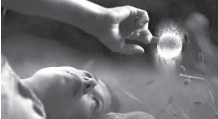
Figura 3: Burst , Schweppes, 2008

Os anúncios Burst 28 , da Schweppes (Figura 3), e Ballet 29 , da NFL Company in USA, contam-se entre aqueles em que o efeito estético da câmara lenta mais sobressai, a partir de motivos deveras simples: no primeiro, a explosão, em vários cenários, de balões cheios de água; no segundo, um bailado com dois jogadores de futebol americano. Mas o anúncio que combina de forma exímia estética e mensagem é, certamente, o Stop The Bullet 30 , da Choice FM Radio (Figura 4). Mantendo o enquadramento e a trajectória, balas fazem explodir, um após outro, vários objectos colocados sempre na mesma posição: um ovo, um copo com leite, uma maçã, uma embalagem de ketchup, uma garrafa de água, uma melancia. Por último, aparece a cabeça de uma criança, mas, em vez da bala, surgem as letras: Stop the bullets. Kill the gun.