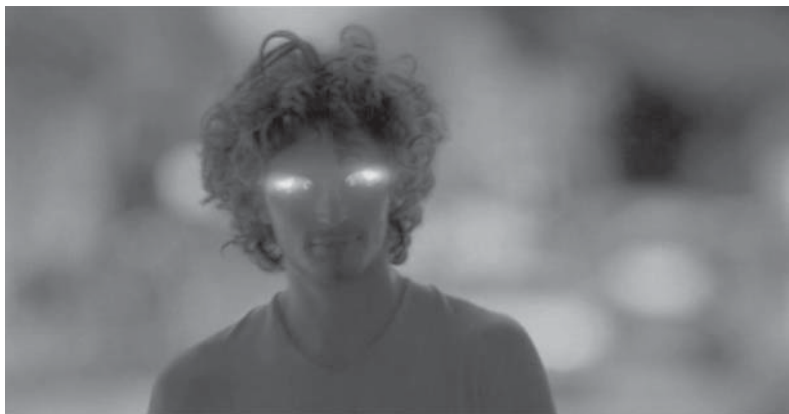
Figura 16: Evolution , Renault, 2006

Este procedimento resulta bastante vulgar no imaginário contemporâneo, que, aliás, caracteriza. Não surpreende, portanto, o sucesso granjeado na área da publicidade. Não só as coisas se transformam em figuras humanas (por exemplo, o Bibendum , o Homem da Michelin, criado em 1898) como, proeza que Arcimboldo não ousou conceber, seres humanos se transformam em coisas (por exemplo, nos anúncios Evolution 62 , da Renault, e Human car 63 , da Ford, um jovem e um grupo de bailarinos transformam-se em carros).