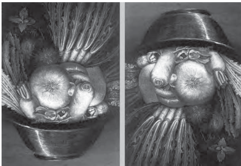
Figura 15: Giuseppe Arcimboldo, O Horticultor , 1590

Na história da arte, em matéria de ilusões, Giuseppe Arcimboldo (1527-1593) é um sério rival de M. C. Escher (1892-1972). Com os fragmentos de uma ordem da realidade, Arcimboldo constrói uma realidade fragmentada de outra ordem (Figura 15). Com alimentos, compõe um cozinheiro (1570), com flores, uma princesa ( Flora , 1591) e com vegetais, um Horticultor (1590)... Uma “alquimia” que se assume como “a arte de decompor uma ordem e compor uma desordem” (Sarduy, 1972: 17).