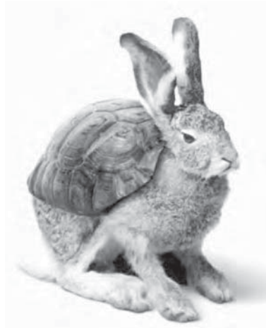
Figura 5: Hale/Tortoise , Volkswagen, 2002

No anúncio Fountain 36 , da Audi, coabitam duas configurações espaço-temporais: uma, acelerada e a outra, retardada. Numa estrada de montanha, um automóvel pisa um lençol de água provocando um jacto que se precipita em câmara lenta; entretanto, o carro desce a encosta a alta velocidade e estaciona; após um compasso de espera, a água cai, sempre em câmara lenta e com belo efeito, sobre o automóvel. Embora opostas, as duas configurações espaço-temporais não se limitam a coexistir, também interagem.