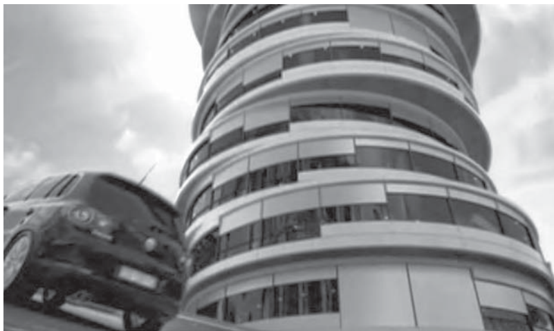
Figura 14: Moving City , Volkswagen, 2007

Outro automóvel avança numa cidade onde nada permanece estável: tudo se move, tudo se transforma, como se fosse construída com legos hiperactivos. Alteram-se os prédios, as casas, os pavimentos, as garagens... Como diria Pascal (1998:38), não há “fundamento fixo” onde se firmar. Tudo é movimento. “A cidade nunca descansa”. E, no entanto, o carro prossegue, impávido, a sua rota até ao destino (Figura 14). O anúncio é da Volkswagen e chama-se Moving City 60 .