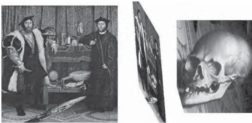
Figura 9: Hans Holbein, Os Embaixadores , 1533

Por falar em quadros, Os Embaixadores (1533) de Hans Holbein é uma obra que nos desafia. É um mistério cheio de segredos. O quadro não só versa sobre uma intriga como está, ele próprio, organizado como um enigma. Não identifica as personagens: não se sabe quem são, nem o que fazem, nem de onde vêm. Mas o quadro contém todas as chaves necessárias à descoberta. Omar Calabrese dedica um longo texto à análise sistemática desta obra (Calabrese, 1997: 35-68). No que nos diz respeito, vamos focalizar-nos apenas no efeito mais célebre da composição: a anamorfose. Se observarmos o quadro (Figura 9), a nossa atenção é atraída por uma forma anómala, uma mancha de tamanho apreciável, em baixo, ao centro. Erro ou desleixo são hipóteses que não condizem com Holbein, um dos mestres mais meticulosos de toda a história da pintura. De facto, aquela mancha configura uma anamorfose: contemplada de um certo ângulo, assume a forma de uma caveira, de uma vanitas (Figura 9). Artimanhas da perspectiva. O certo é que esta ilusão representa uma pista primordial para o acesso à verdade do quadro Os Embaixadores , para a sua correcta interpretação.