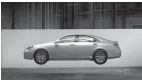
Figura 11: Perspective , Lexus, 2008