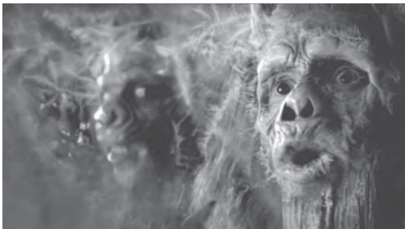
Figura 6: noitulovE (Evolution) , Guinness, 2006

No segundo anúncio, Past Experience , da Heineken 40 , um homem sai para comprar cerveja. Durante a viagem de táxi, tudo muda: os prédios, as ruas, os carros, as pessoas... Entra num bar do século XIX onde, surpreendentemente, o sabor da cerveja continua “exactamente o mesmo”: “ Heineken unchanged since 1873 ”. Neste anúncio, o passado e o presente reforçam-se mutuamente: contra ventos e marés, a Heineken manteve-se inalterável; nasceu perfeita e assim continuará.