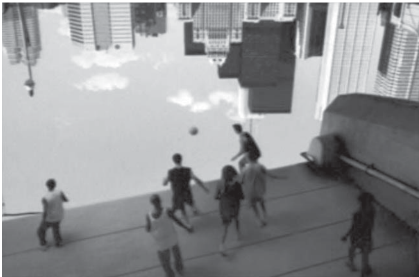
Figura 13: Upside down , Peugeot, 2001

(Kerckhove, 1997: 38). Mexem connosco e, sobretudo, conduzem-nos a experienciar o impossível. Eis a principal razão para o tamanho do quadro ter que ser maior do que o tamanho do mundo. Para pintar, além das paisagens e das histórias previstas por Alberti, o sonho e o impossível.