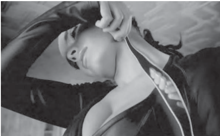
Figura 18: Look what's inside , Unilever, 2007

Estes dois anúncios propõem-nos duas leituras distintas da fragmentação, que, sublinhe-se, não implica necessariamente alienação. Em Look what's inside , deparamo-nos com uma colecção de mulheres; em Recette d'une femme mode , com uma mulher plural. Esta última, pode não saber exactamente quem é, nem conseguir regressar ao núcleo da sua individualidade, o “não sei quê” que talha a identidade e o “quase nada” que faz toda a diferença (Jankélévitch, 1980). Tropeça, mesmo assim, no nome e na carne. Este texto já vai longo e quanto mais se expande mais se assemelha a um mosaico do Gaudi no Parque Güell. Urge encontrar um par de chaves para o fechar.