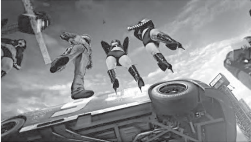
Figura 8: Underground , Fox Sports Marketing, 2009

metros de profundidade. Com a garantia de se ver como nunca antes ninguém viu. O fenômeno lembra a Professora Frizadinha a levar os seus alunos aos sítios mais inacessíveis a bordo da “Carrinha Mágica”, numa série de animação para crianças da autoria de Joanna Cole e Bruce Degen, estreada em 1994. É certo que, graças às sondas, às endoscopias, às ecografias, às webcams e às nanotecnologias, nunca estivemos tão perto de embarcar numa “carrinha mágica”, de preferência toda envidraçada como as cabines da London Eye.