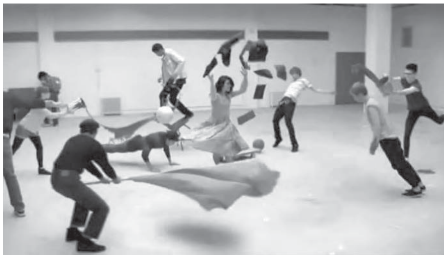
Figura 7: Time Sculpture , Toshiba, 2008

Velocidade normal, retardamento, retrocesso, imobilização, looping . E se um único anúncio contemplasse, simultaneamente, todos estes movimentos? Qual seria o resultado? Caos ou beleza?