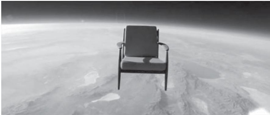
Figura 1: Space chair , Toshiba, 2009

tenta esmagar automóveis Peugeot 6 ou aqueloutro que pesca homens utilizando um Renault Clio como isco 7 , não deixam de lembrar o bom Gargântua a roubar os sinos da catedral de Notre-Dame de Paris. Mas o gigante que nos torna míopes é aquele em que estamos embarcados: o nosso planeta. Seria despropositado traçar uma lista dos anúncios que mostram a Terra fotografada ou filmada do espaço. Vamos cingir-nos a uma publicidade recente da Toshiba ( Space chair 8 ): uma cadeira, suspensa num balão, munida com oito câmaras, filma, à medida que sobe, o planeta Terra. O slogan da versão portuguesa é particularmente sugestivo: “inovar é ver como ninguém viu”. “Ver como ninguém viu”, porventura mais do que ver “o nunca visto”, eis a tentação ou, melhor, a proposta que percorre a publicidade actual.