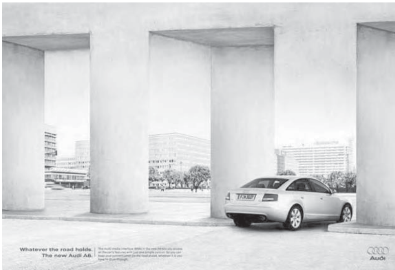
Figura 12: Illusions , Audi A6, 2004 (Outdoor)