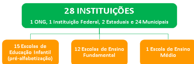
Figura 1: Panorama das Instituições participantes

do direito da infância: Declaração dos Direitos da Criança (ONU, 1959), a Convenção sobre os Direitos da Criança (ONU/UNICEF, 1989) e o Estatuto da Criança e do Adolescente (Lei n.º 8.069/1990). No esquema abaixo apresentamos o panorama dos atores envolvidos: