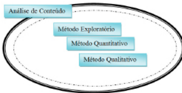
Figura 1: Conjunção de métodos

Ainda mais quando se tem como peça algo físico a ser estudado, e como ambiente exploratório, o meio virtual. Tendo esta pesquisa como objeto de estudo um canal de televisão fechado, consideramos necessário a construção de um desenho organizado de métodos e técnicas, conforme a Figura 1.