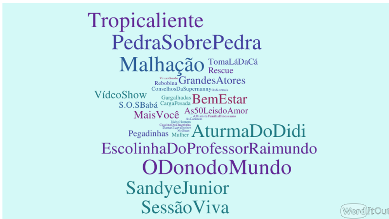
Figura 2. Nuvem de palavras da programação Viva

lugar de destaque na programação do canal. São sempre quatro produções, exibidas a partir da meia-noite (horário nobre da emissora) e reprisadas, na sequência, após as 13h30. Segundo estudo feito por este pesquisador, em maio de 2015, foi constatado que é a teledramaturgia que mais aparece quando investigado os índices de frequência, dentre os títulos que formam a grade de programação (Bressan Junior & Costa, 2015). A figura a seguir expõe este resultado.