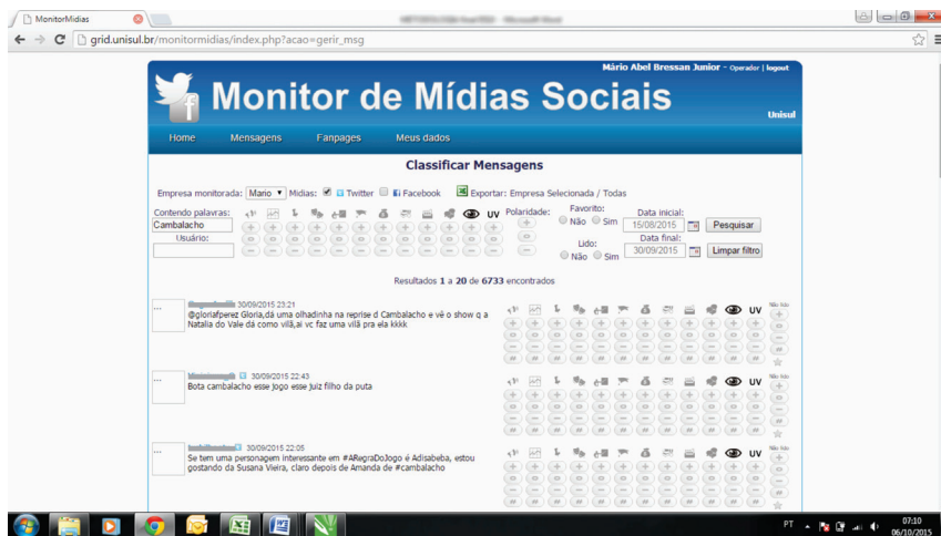
Figura 3: Funcionamento da ferramenta Grid

O sistema captura, na íntegra, todas as postagens que contém a expressão desejada, identificando dia, horário, nome do perfil do usuário e link para visualização do post . Além disso, oferece alternativas para a classificação da mensagem, podendo classificá-la em positiva, negativa, neutra e não se aplica.