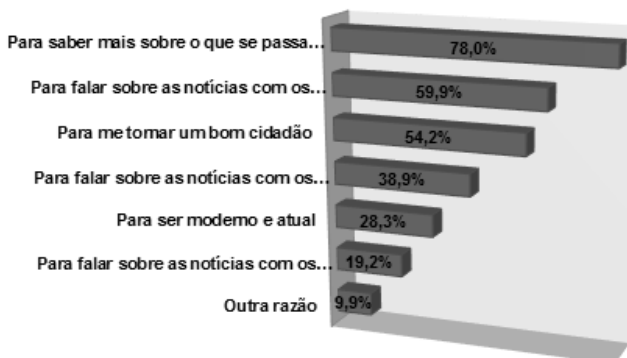
Gráfico 2: Razões para gostar de acompanhar as notícias (N=568)

A principal razão apontada pelas crianças para gostarem de acompanhar as notícias está relacionado com o lugar que os media ocupam no cotidiano dos cidadãos ao contribuírem para o conhecimento do mundo e a ampliação de um conjunto de saberes. Segundo Marôpo (2014, p. 106), os media ganham “importância à medida que [têm] vindo a desempenhar um papel mais central na maneira como as crianças e jovens interpretam