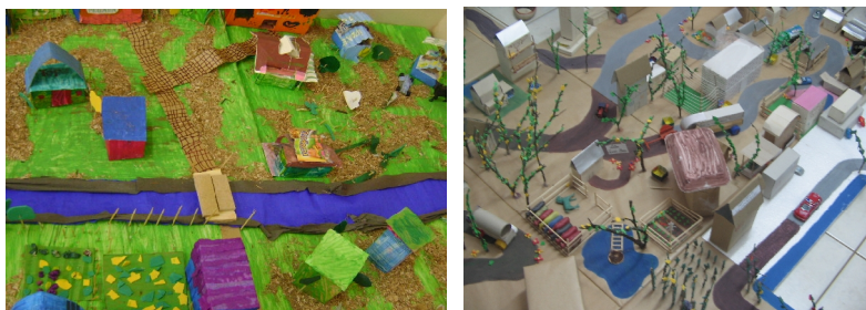
Fig. 1. Fotos de maquetes construídas por alunos de escolas do projeto Civitas.

A partir daí iniciou-se uma interação entre as prefeituras municipais, professores e universidade, onde foram envolvidas contrapartidas de todos para o planejamento pedagógico em torno das cidades virtuais. A equipe do LELIC e os professores trabalharam conjuntamente em projetos detalhados para discutir as práticas pedagógicas tradicionais na consideração do mundo desafiante de um ensino que possui as cidades virtuais como eixo central deste processo.