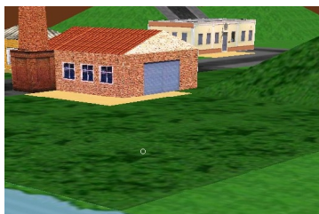
Fig. 5. Visualização do efeito de poluição (área escura do terreno).

A assistente Maga Vitta é um agente inteligente projetado para ser o regulador ecológico do Città [11]. Durante o jogo, de acordo com as ações realizadas pelo usuário, podem ocorrer, entre outros fatores, sinais de poluição ao redor de determinadas construções. Por exemplo, ao redor de uma fábrica, o terreno ficará cada vez mais poluído, como mostra a diferença das texturas de verde na Fig. 5, ao redor de uma fábrica.