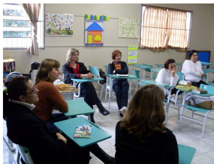
Fig. 2. Reunião de professoras do projeto Civitas em Venâncio Aires (RS), Brasil.

O projeto tem como importante objetivo aliar o trabalho curricular de sala de aula com a proposta do projeto – explorar as possibilidades da construção de uma cidade virtual em benefício da aprendizagem e do conhecimento. As professoras acabaram por notar que precisariam discutir de modo mais sistemático e aprofundado as questões educacionais surgidas da inserção de uma nova tecnologia na sala de aula. A descrição das práticas, a identificação de problemas comuns, a necessidade de leituras teóricas que subsidiassem as discussões sobre possíveis soluções, tudo isso levou a romper, aos poucos, com as práticas rotineiras e a compor novas linhas de ação. A exemplo do que faziam no grupo de estudos, passaram a experimentar discutir com as crianças sobre como estudar a cidade, como se organizar para colher dados interessantes, o que eram dados interessantes, o que era “necessário” aprender sobre a cidade em que viviam.