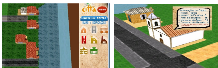
Fig. 4. Modo de construção (esq.) e visualização das propriedades do objeto igreja no Città.

Para realizar a criação, basta o aluno clicar no botão construir e após no botão de imagem de edificação desejada e fazer sua localização no terreno. Após criado, cada prédio possui um conjunto de propriedades, como número de habitantes, etc. (Fig. 4).