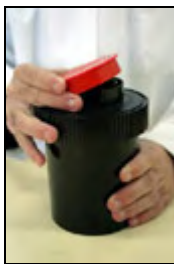
13) Colocación final de la tapa al tanque

Este tipo de secuencias de imágenes son de mucha utilidad docente ya que, puede servir para ilustrar el proceso en el aula, sin estar en el laboratorio e incluso sin tener el material necesario. Estos procesos se hacen especialmente necesarios en disciplinas eminentemente prácticas o experimentales. En este caso concreto es de especial ayuda, sobre todo si tenemos en cuenta que este proceso se tiene que realizar en gran parte en absoluta oscuridad (sin ninguna luz), para que no se impresione la película que va a ser revelada. Por tanto, es imprescindible explicar el proceso previamente a su realización práctica.