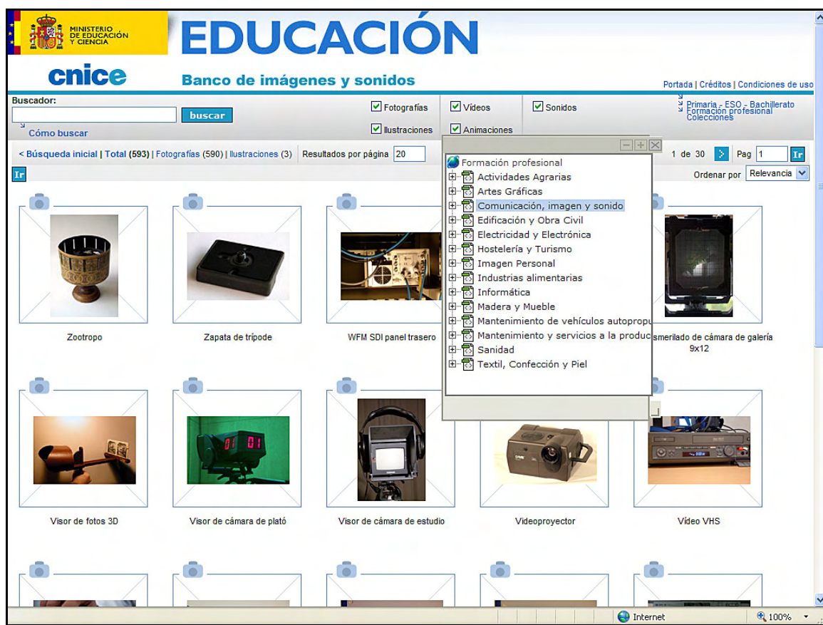
Ejemplo de resultado de búsqueda en la categoría FP: Comunicación, imagen y sonido

En el caso del ejemplo podemos ver que hay un total de 593 imágenes en esa categoría, de las cuales se mostrarían las primeras veinte. El sitio las muestra inicialmente en mosaico, de modo que se pueden ver al pinchar sobre ellas en tamaño medio y con toda la metainformación comentada.