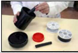
8) Preparación del tanque