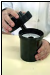
12) Cerrado a rosca de las parte superior del tanque