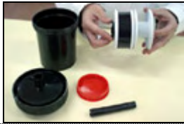
10) Colocación de la segunda espiral