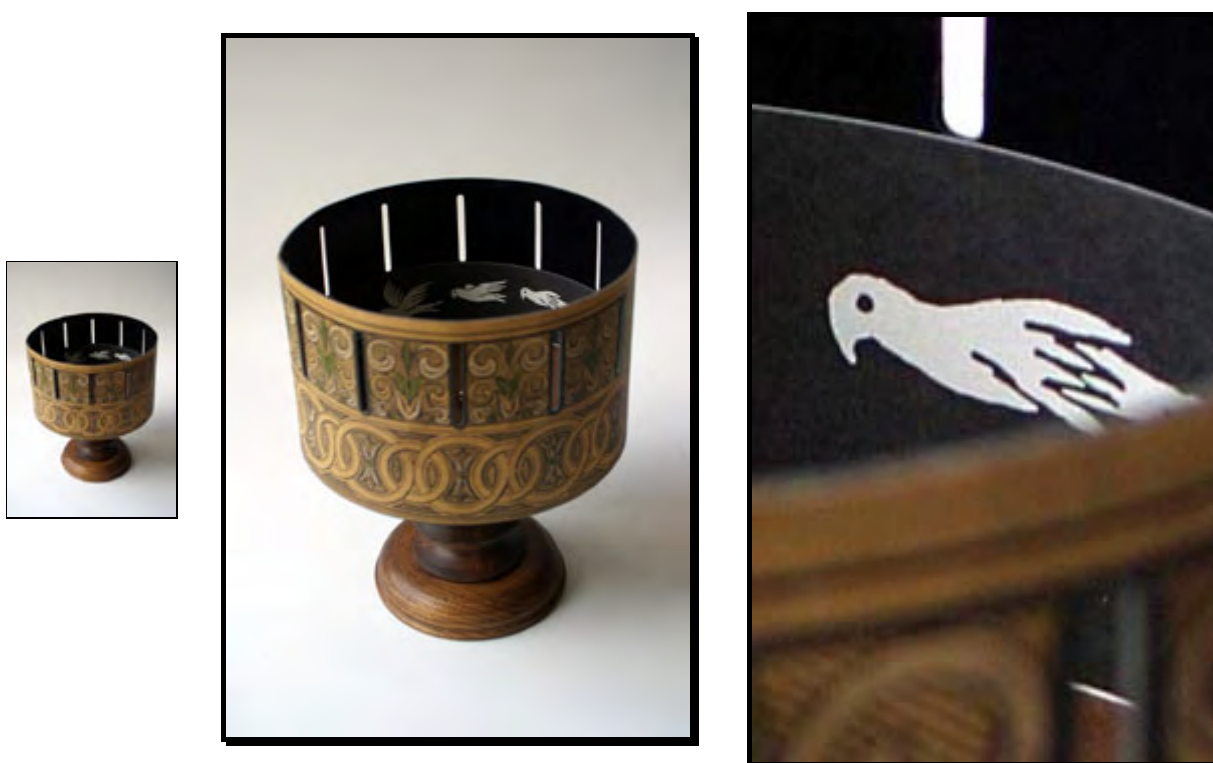
Calidades en las que se ofrece cada imagen (baja, media y alta –detalle–)

Alta: imagen JPEG, compresión baja, de 2048 x 1360 píxeles y 72 ppp.