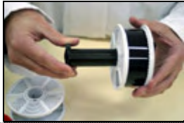
9) Inserción del eje del tanque en la espiral