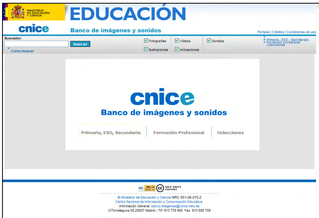
Página de inicio del Banco de Imágenes del CNICE (07/2007) a la que se llega tras una pequeña presentación Flash

Como se puede apreciar, el Banco no sólo incluye entre sus recursos imágenes fijas aisladas (fotografías o ilustraciones), sino que también incluye otro tipo de recursos, como son vídeos o sonidos.