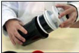
11) Introducción del conjunto en el tanque