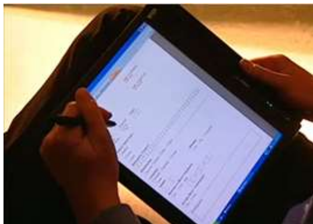
Gambar 2 Formulir Elektronik pada Komputer Tablet