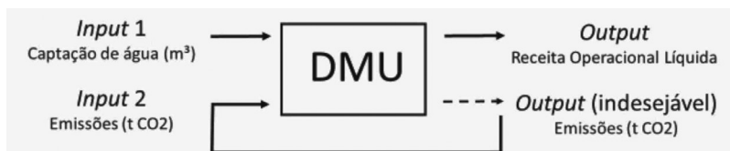
Figura 3 – Elementos da DMU

As variáveis trabalhadas no estudo foram os inputs “Captação de água (m 3 )”, referindo-se ao volume de água utilizada na produção de papel das empresas e “Emissões (t CO 2 )”, ou seja, o quanto de CO 2 está sendo emitido pelas empresas no processo de fabricação do papel. Emissões de CO 2 seria um output indesejável. Neste caso, para haver coerência no tratamento do output indesejável, no sentido de reduzir seu impacto, uma forma de atender ao problema matemático é torná-lo um input . Esta abordagem pode ser utilizada para modelos DEA BCC e CCR, dependendo das escalas de operação das unidades avaliadas (GOMES, 2003). A Figura 3 apresenta o sistema de inputs e output para as DMU.