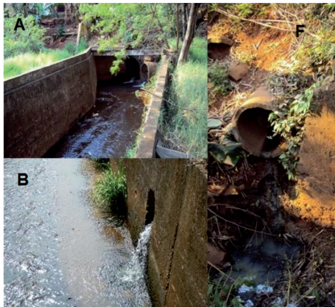
Figura 2. Alguns pontos de coleta de amostra de água nos rios Bolinha e Alegria em Medianeira, PR.

Ponto H – Localizou-se entre um posto de combustível e um hospital.