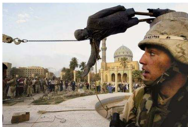
Imagem 2: Invasão do Iraque. 2003. 17

símbolos de Saddam Hussein foram destruídos.