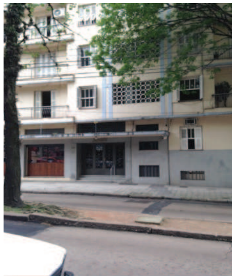
Figura 1: Primeira sede em sala alugada no Edifício Jequitibá

A seguir são apresentadas fotos das antigas sedes do Instituto de Matemática: