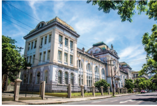
Figura 3: Terceira sede no terceiro pavimento do Edifício do antigo Instituto Parobé