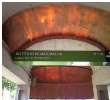
Figura 4: Sinalização externa do Campus Vale

O IME compõe um conjunto formado pela sede administrativa, no andar térreo do Prédio 43111; pelo andar térreo e superior do prédio 43112 ocupado por salas dos docentes; dois módulos de serviço entre prédios (onde se localizam Diretório Acadêmico, reprografia, cozinha, banheiros, almoxarifado e depósito); pelo anfiteatro e dois laboratórios de informática, no prédio 43123; e pela Biblioteca, no andar térreo do prédio 43124.