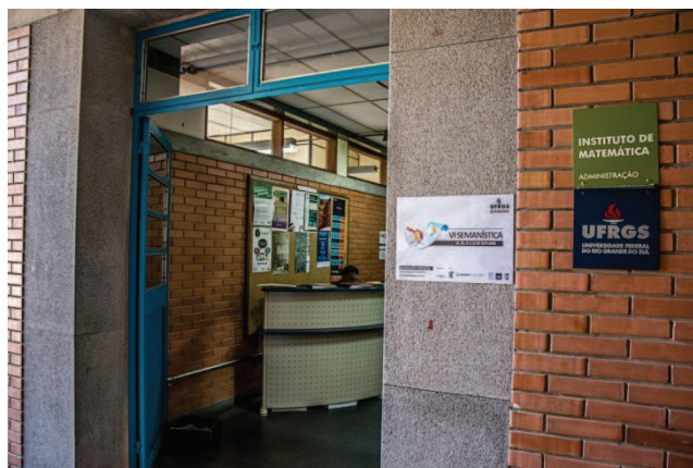
Figura 6: Recepção do IME