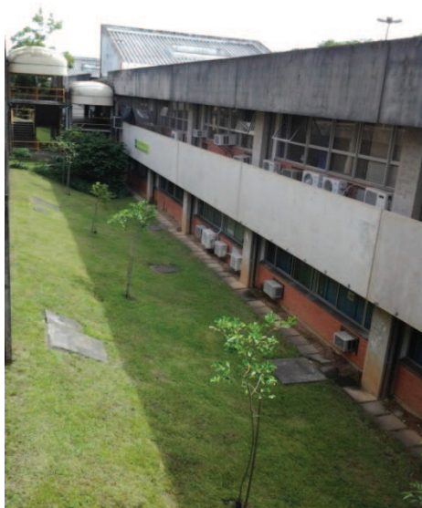
Figura 5: Alameda de acesso ao IME entre os Prédios 43211 e 43212.