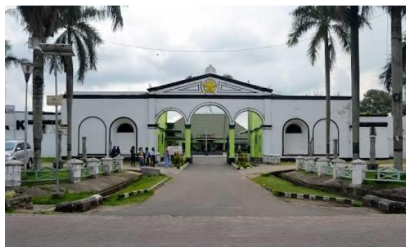
Gambar 5 Benteng Kuto Besak

Data dari Google Maps ditunjukkan pada Tabel 3 berikut. Total Skor dihitung dengan mengalikan nilai review dengan jumlah review. Menariknya, Jembatan Ampera hanya berada pada posisi kedua. Tenganan paling populer justru adalah Palembang Square Mall, sebuah pusat perbelanjaan.