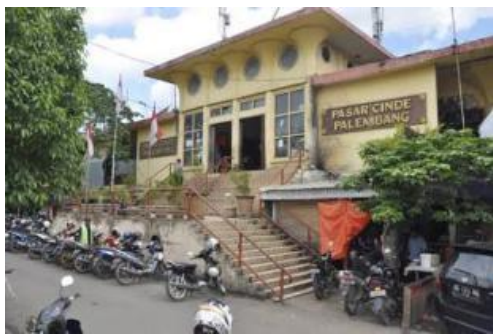
Gambar 3 Pasar Cinde (Google Image)