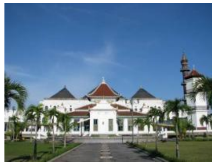
Gambar 4 Masjid Agung