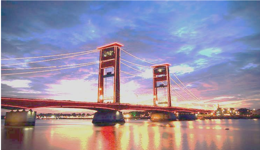
Gambar 2 Jembatan Ampera Palembang