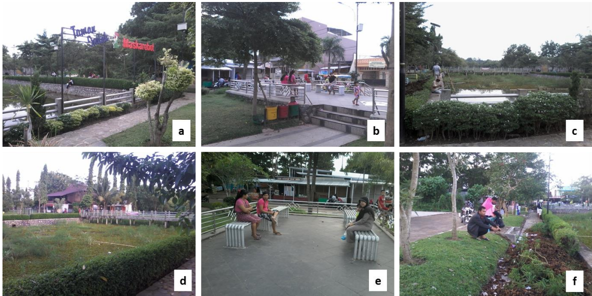
(a) Identitas Taman Indah Maskarebet dan kolam retensi yang sebagian telah diturap, (b) Plaza Taman Indah Maskarebet yang dilengkapi dengan bangku taman berbahan galvanis dan balustrade dari stainless, (c) Sebagian kolam retensi yang telah dikeruk dan diturap, dimanfaatkan warga untuk kegiatan mancing, (d) Jembatan membelah kolam retensi yang dipenuhi oleh gulma air, (e) Bangku taman dari bahan pipa galvanis, (f) Pedestrian disisi kolam retensi yang dimanfaatkan warga untuk jogging dan fitness, pedestrian tertimbun sampah gulma air.