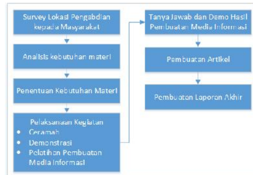
Gambar 2. Metode Pelaksanaan

Metode pelaksanaan atau tahapan yang dilakukan dalam program pengabdian masyarakat ini ditunjukkan pada Gambar 2