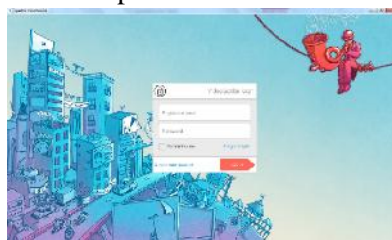
Gambar 3. tampilan awal aplikasi Videoscribe

Sebelum membuat media menggunakan aplikasi videoscribe dari sparkol, kita harus mendownload aplikasi videoscribe terlebih dahulu melalui login dengan email di http://www.sparkol.com kemudian download aplikasinya di web tersebut . Aplikasi ini support dengan windows Xp, 7-10. Setelah itu install aplikasi tersebut pada komputer anda. Setelah selesai jalankan aplikasi tersebut sehingga nampak tampilan yang dapat dilihat pada Gambar 3. Pelaksanaan Pengabdian kepada masyarakat kali ini menggunakan videoscribe versi offline yang dapat dilihat pada Gambar 4.