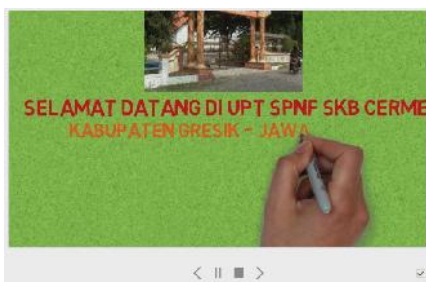
Gambar 4 media promosi kegiatan SKB Cerme

Adapun tampilan hasil pembuatan videoscribe yang dapat digunakan sebagai media promosi bagi SKB Cerme, dapat dilihat pada Gambar 4. Selain itu pihak SKB Cerme dapat mengunggah hasil videoscribe yang berupa video animasi yang interaktif pada laman profile SKB Cerme, Youtube maupun berbagi video dengan aplikasi yang lainnya.