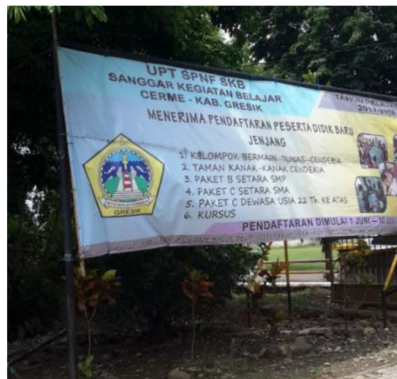
Gambar 1. Program SKB Cerme Gresik

Unit Pelaksana Teknis (UPT) Satuan Pendidikan Non Formal (SPNF) Sanggar Kegiatan Belajar (SKB) Cerme – Gresik, untuk selanjutnya ditulis SKB Cerme merupakan lembaga pendidikan non formal yang berada di wilayah kabupaten Gresik serta di bawah naungan dinas pendidikan kabupaten Gresik. Satuan pendidikan ini memiliki tugas pokok menyelenggarakan program Kelompok Bermain Tunas Cendekia, Taman Kanak-Kanak Cendekia, Paket B Setara SMP, Paket C Setara SMA, Paket C Dewasa Usia 22 Tahun ke atas, dan Kursus Menjahit. yang dapat dilihat pada Gambar 1.