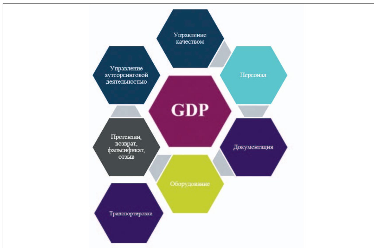
Рис. 2. Ключевые составляющие GDP

Ключевые составляющие, которые регламентируются отечественными и зарубежными принципами GDP, представлены на рисунке 2.