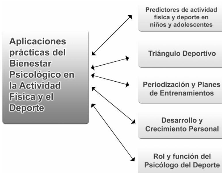
Figura 3. Aplicaciones prácticas del bienestar psicológico en la actividad física y el deporte

el futuro, autovaloración de la aptitud deportiva, forma física percibida y salud percibida predicen positivamente tanto en chicos como en chicas, la práctica del deporte y la práctica del ejercicio físico intenso. De todas maneras se hace necesario evaluar el bienestar realizando diferencias de género, ya que como se ha indicado en otros estudios (Brustad, 1996) las diferencias podrían ser sustanciales (ver Figura 3).