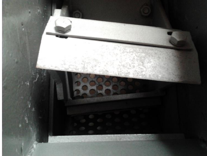
Gambar 1. Pisau Putar mesin pencacah sampah botol plastik

Alat ini dikendalikan secara mudah, praktis, bekerja secara non-stop serta secara mekanis mudah dalam perawatan dan perbaikan. Alat ini dapat memberikan tambahan wawasan dan pengalaman inovasi teknologi bagi kelompok usaha pencacahan limbah sampah botol plastik.