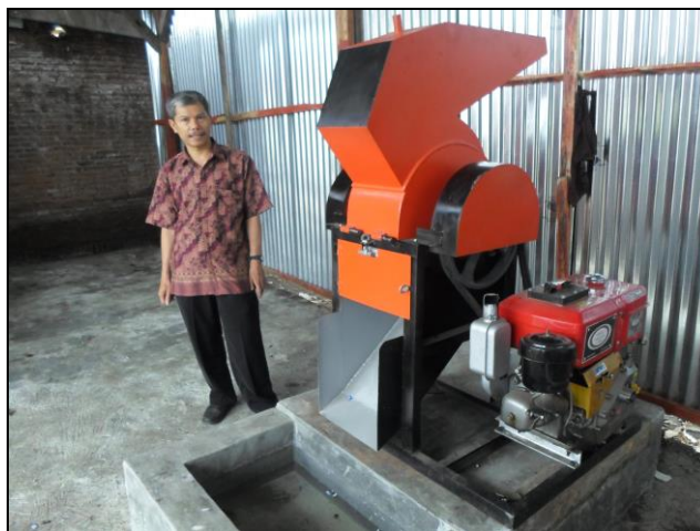
Gambar 3. Mesin pencacah sampah botol plastik

Kegiatan terakhir yaitu Monitoring dan evaluasi pada mitra IbM I dan mitra IbM II sebagai tindak lanjut keberlanjutan program yang dilaksanakan. Kegiatan ini dilakukan dengan dasar keberlanjutan agar program ini terus berlanjut dan mengurangi sampah botol plastik untuk dijadikan biji plastik sehingga akan berdampak pada ekonomi masyarakat. Monitoring dilakukan dengan durasi waktu setiap tri wulan, yaitu memonitor kinerja mesin dan juga memonitor manajemen produksi dari pencacahan limbah plastik yang ada pada mitra IbM II maupun pada mitra IbM II.