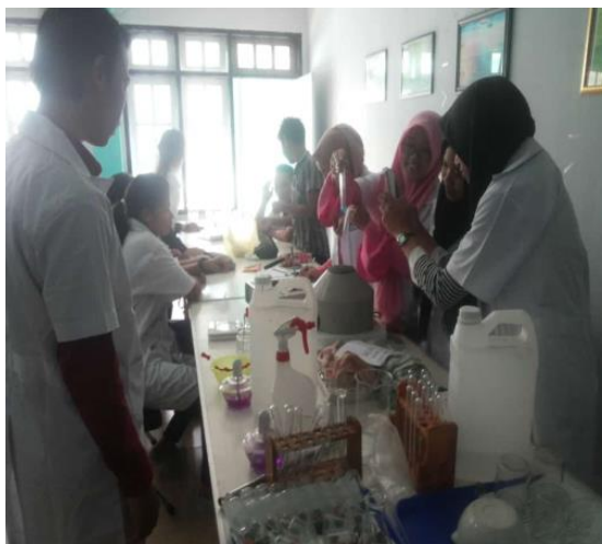
Gambar 1. Kegiatan Praktikum Mahasiswa

Buku petunjuk praktikum berbasis inkuiri terbimbing dapat meningkatkan kerja ilmiah mahasiswa. Partisipasi mahasiswa dalam kegiatan penyelidikan melalui praktikum mendorong mahasiswa untuk mengajukan pertanyaan, merumuskan hipotesis, melakukan percobaan, menggunakan alat untuk mengumpulkan data, menganalisis data, menyimpulkan dan berargumentasi merupakan serangkaian kegiatan yang dapat mengembangkan kemampuan kerja ilmiah mahasiswa dan membuat mahasiswa belajar secara aktif dalam menemukan konsep.