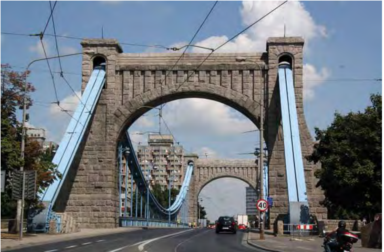
Fig. 2. Most Grunwaldzki we Wrocławiu. Pylony wykonane z granitu karkonoskiego, fot. M.W. Lorenc • Pylons of the Grunwald Bridge in Wrocław built of the Karkonosze granite, phot. M.W. Lorenc