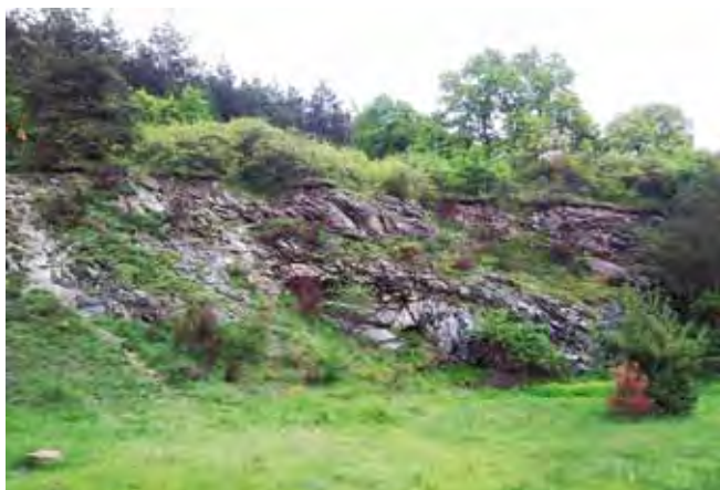
Fig. 16. Kamieniołom serpentynitu w Przemilowie • Serpentine quarry in Przemilów