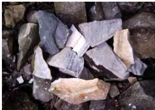
Fig. 14. Marmur z Przeworna • The marble from Przeworno

Do zdecydowanej większości z nich trudno dotrzeć, a dojazd w bezpośrednie sąsiedztwo jest wręcz niemożliwy i trzeba w końcowym etapie zdecydować się na kilkudziesięciminutową, pieszą wycieczkę. Tektonikę kredowych piaskowców Gór Stołowych proponujemy podziwiać w nieczynnym dziś kamieniołomie w Szczytniej, choć tak naprawdę, administracyjnie, położony on jest już na terenie Polanicy Zdrój. Dojazd do tego kamieniołomu jest bardzo dobry i trafić do niego łatwo. Ze Szczytniej, z drogi krajowej nr 8, skręcamy w ulicę Sienkiewicza, w kierunku Polanicy Zdrój. Po przejechaniu ok. 4 km, tuż za mostem nad wijącym się wzdłuż lewej strony drogi strumieniem, skręcamy ostro w lewo,