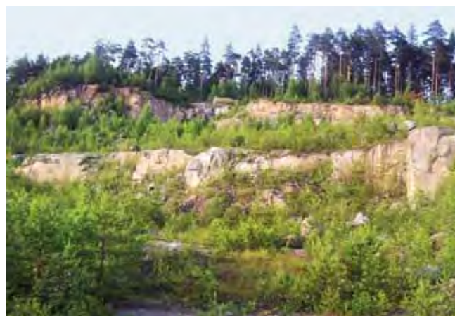
Fig. 11. Dobrze zaznaczony strop ławicy piaskowca w kamieniołomie w Szczytniej. Widok z wyżej leżącej ławicy • Very well marked top of the sandstone bed in the Szczytna quarry. A view from the upper bed

zać się niebezpieczna i nadzór kopalni wcale nie musi się na nią zgodzić.