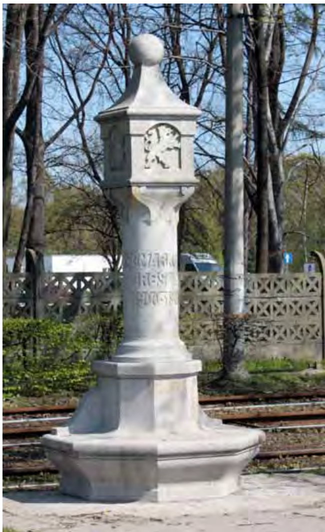
Fig. 1. „Gemarkung Breslau” – słup graniczny miasta. Jedna z trzech ocalałych, ustawionych na przełomie XIX i XX w., rogatek Wrocławia • „Gemarkung Breslau” – city border mark. One of three survived Wrocław border marks erected on the break of 19th and 20th century

Przyjmuje się, że kamieniołomy granitu istniały tu już od XII w. p.n.e. i funkcjonowały aż do XIII w. (Domański 1965). Dzisiaj eksploatuje się w tym rejonie kilka odmian granitu, których nazwy pochodzą od nazw miejscowości: „Strzegom”, „Borów”, „Rogoźnica”, „Morów”, „Kostrza”, „Strzeblów” czy „Zimnik”.