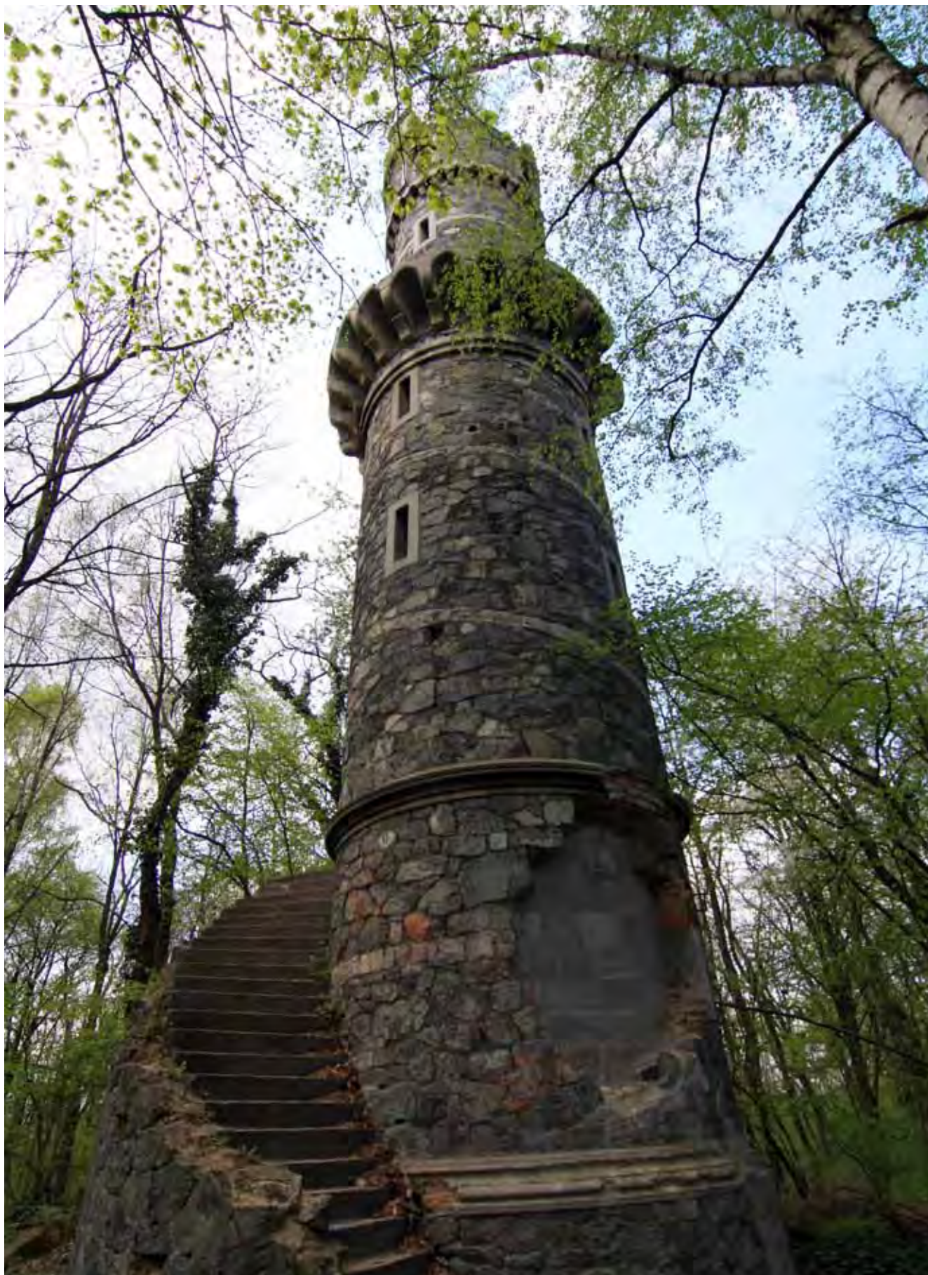
Fig. 18. Wieża Bismarcka na Jańskiej Górze wzniesiona z serpentynitu • The Bismarck Tower built of the serpentinite on the top of the Jańska Mountain