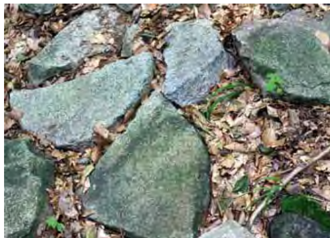
Fig. 8. Kamieniołom starożytny na zboczu Ślęzy i leżące w pobliżu fragmenty rozbitych kamieni żarnowych • Abandoned quarry on the Ślęża Hill slope. Note fragments of the broken mill-stones