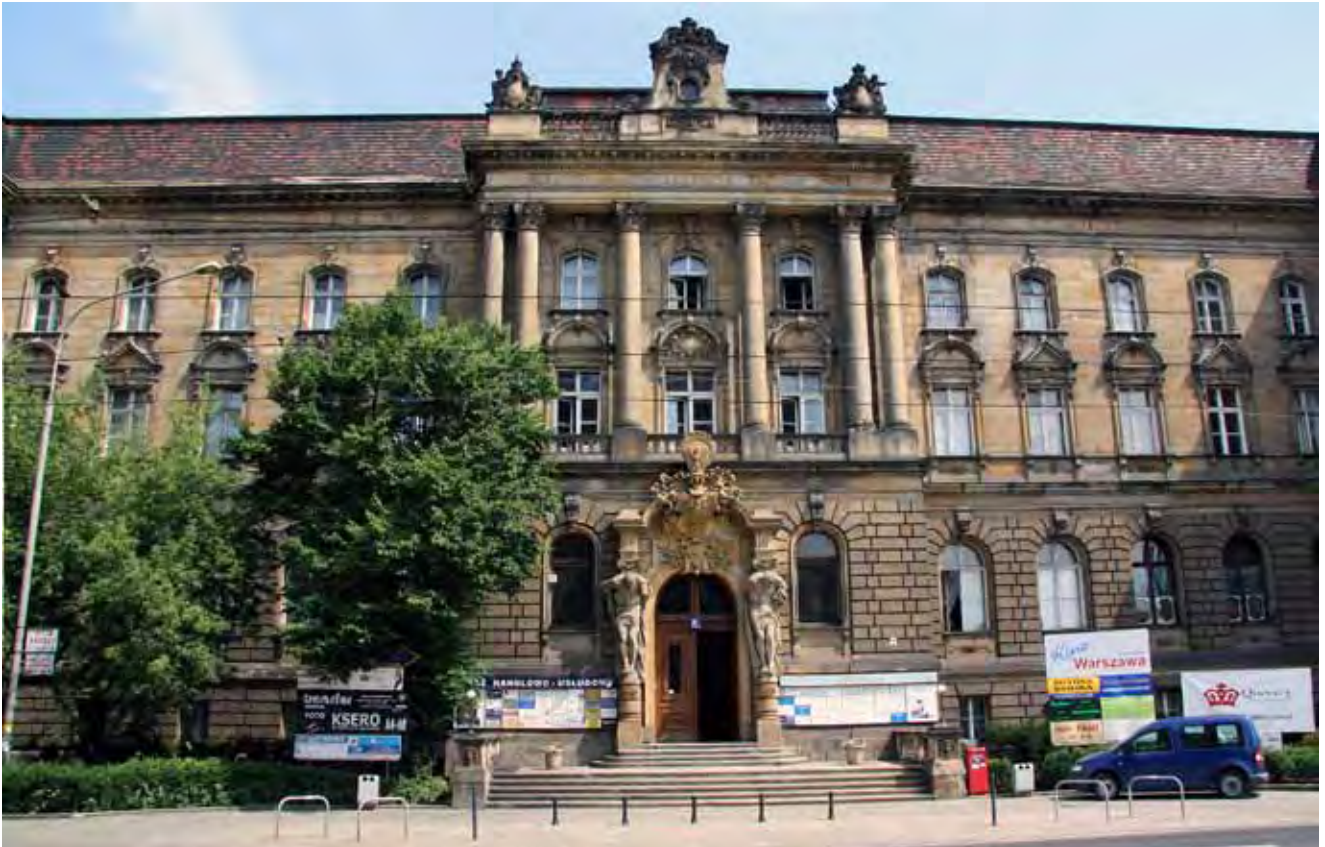
Fig. 4. Elewacja budynku NOT, Wrocław, ul. Piłsudskiego 74. Piaskowiec na budowę w latach 1894–1896 dostarczała firma Zeidler & Wimmel i określiła go jako „piaskowiec śląski” • Facade of the NOT building in Wrocław, Piłsudskiego Str. 74 made of so-called “Silesian sandstone” delivered by Zeidler & Wimmel firm in 1894–1896