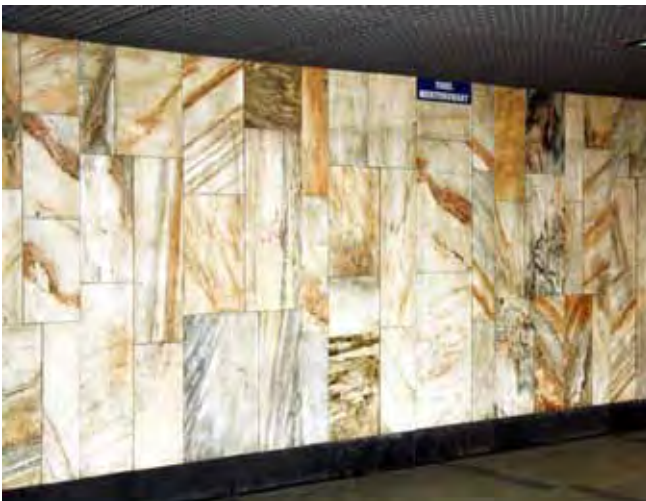
Fig. 5. Ściana przejścia dla pieszych pod placem Dominikańskim we Wrocławiu wyłożona jest marmurem „Marianna”, fot. M. W. Lorenc • Wall of the pedestrian path under the Dominikański Square in Wrocław covered with the „Marianna” marble, phot. M. W. Lorenc