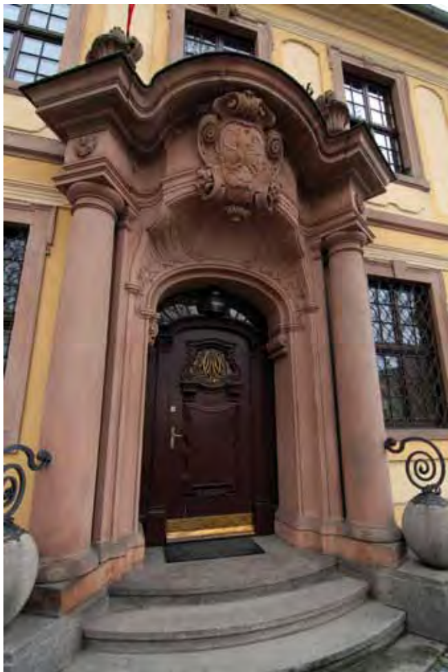
Fig. 13. Portal z czerwonego piaskowca z Gór Stołowych (Heuscheuer Sandstein) w budynku dziekanatu Wydziału Filologicznego Uniwersytetu Wrocławskiego od strony ul. Grodzkiej. Dziś taki piaskowiec czasami wydobywa się w kamieniołomie w Radkowie, fot. S. Mazurek • Portal made of the red Stołowe Mountains sandstone (known as Heuscheuer Sandstein). Faculty of Philology, Wrocław University, Grodzka Str. Recently such sandstone is exploited in some parts of the Radków quarry, phot. S. Mazurek

Aktualnie nie są to obiekty przygotowane na potrzeby masowej turystyki, więc wymagana jest wyjątkowa ostrożność i zachowanie elementarnych zasad bezpieczeństwa.