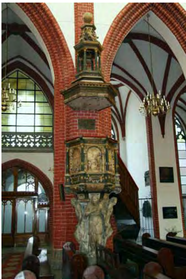
Fig. 17. Ambona w kościele św. Marii Magdaleny we Wrocławiu • Pulpit in the Wrocław St. Mary Magdalene church

W kamieniołomie doskonale widać ławice piaskowców od kilku do kilkunastu metrów grubości, o wyraźnej oddzielności ciosowej, tak charakterystyczne dla kredowych piaskowców z Gór Stołowych (Fig. 11). Z górnego pokładu piaskowca w kamieniołomie możemy przyjrzeć się rozległej powierzchni stropowej ławicy dolnej (Fig. 12).