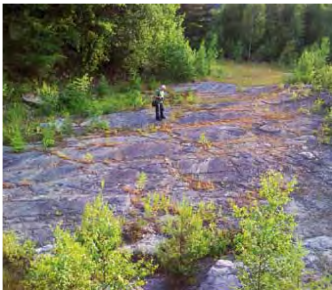
Fig. 12. Kamieniołom piaskowca w Szczytnie, fot. S. Mazurek • The sandstone quarry in Szczytna, phot. S. Mazurek