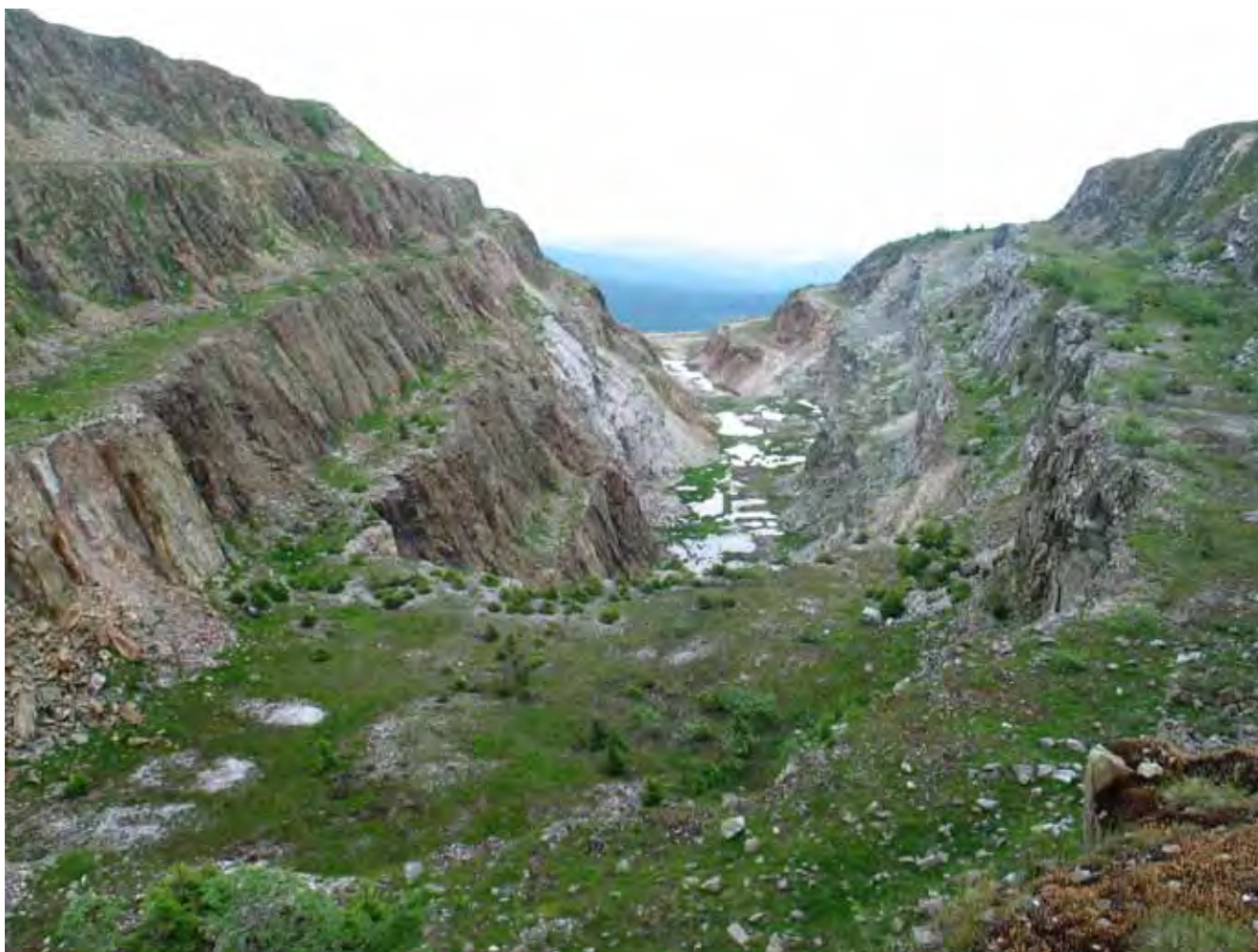
Fig. 19. Kamieniołom kwarcu w Górach Iżerskich, fot. S. Mazurek • Quartz Quarry in the Iżera Mountains, phot. S. Mazurek

Łatwo do niego trafić, gdyż położony jest w samym środku wsi, tuż przy drodze wiodącej z Sobótki przez Księginice Małe do Łagiewnik.