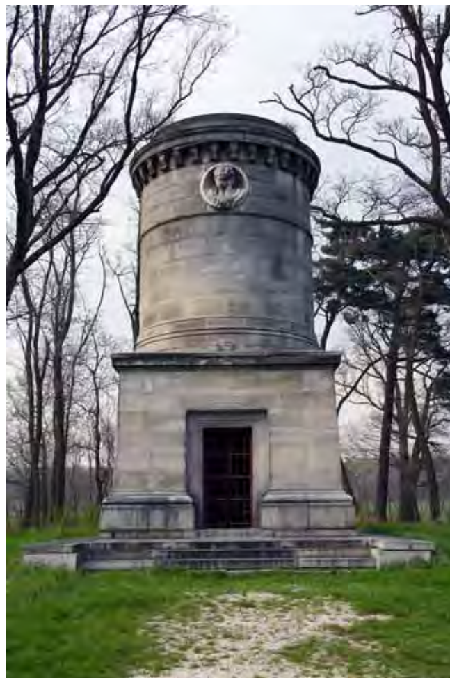
Fig. 10. Mauzoleum Blüchera w Krobielowicach, fot. M. W. Lorenc • The Blücher's mausoleum in Krobielowice, phot. M. W. Lorenc

Trudno dzisiaj zwykłemu turyście wejść w dowolnym czasie do czynnego kamieniołomu bez uprzedniego uzgodnienia tego z kierownictwem kopalni. Wycieczka taka może oka-