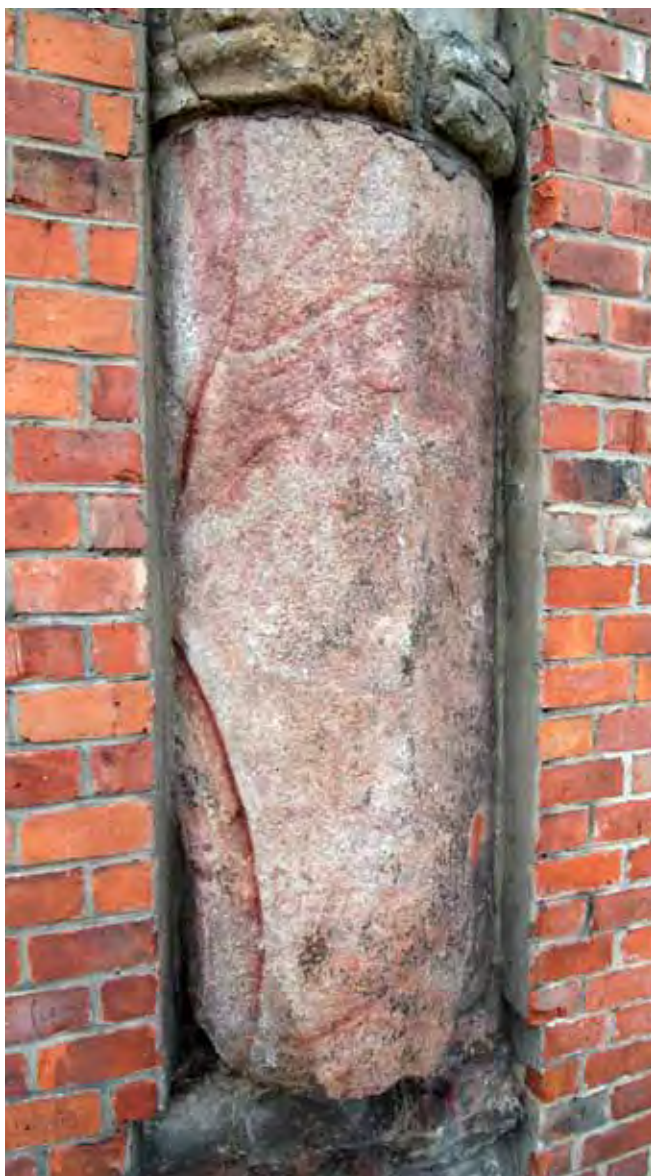
Fig. 9. Pochodząca z XIII w. kolumna z granitu ślęzańskiego w elewacji wschodniej budynku głównego Uniwersytetu Wrocławskiego • 13th Century Ślęża granite column in the eastern wall of the Wrocław University building

Bardzo wytrzymały czerwony piaskowiec, tzw. „Ślązak” od wieków wydobywa się w okolicach Nowej Rudy-Słupca koło Wałbrzycha. Wspaniałym przykładem zastosowania tego piaskowca jest wrocławski most Zwierzyniecki wybudowany w latach 1895–1897. Karl Klimm, projektant mostu, zastosował ten piaskowiec w czterech narożnych, potężnych obeliskach zdobionych secesyjnymi ornamentami (Fig. 3) (Encyklopedia Wrocławia 2000).