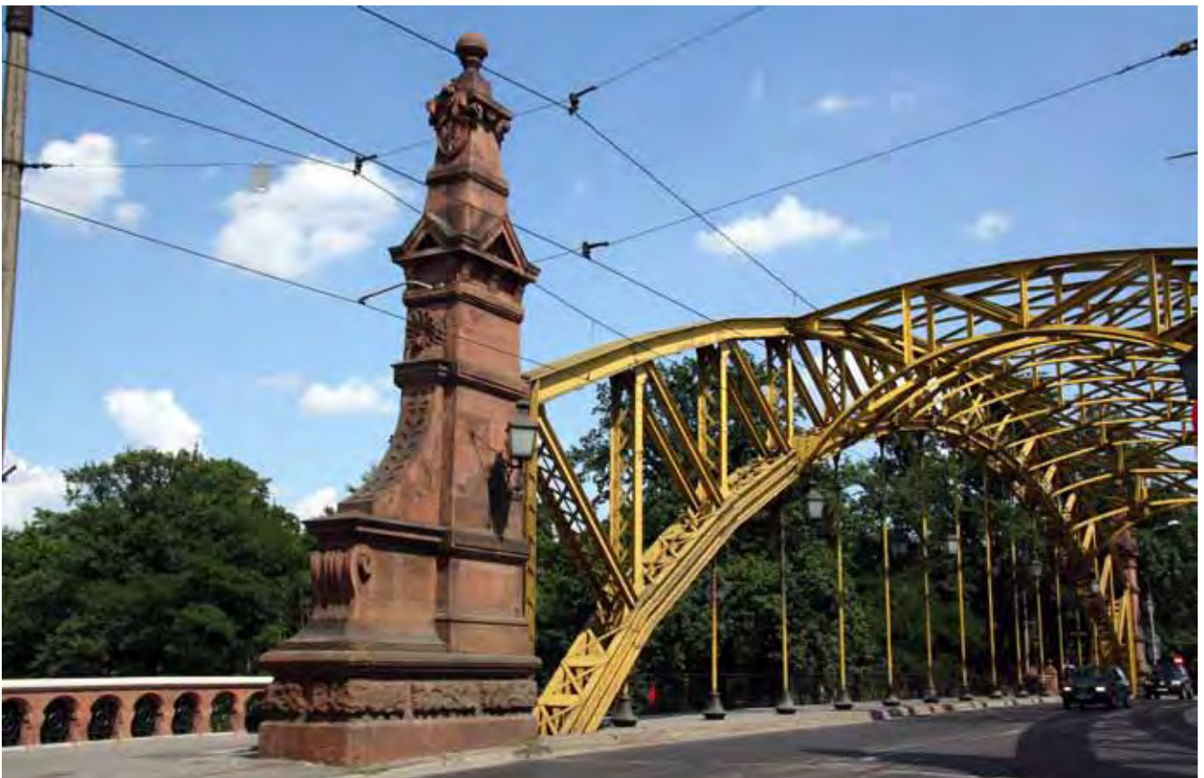
Fig. 3. Obelisk wykonany z czerwonego piaskowca noworudzkiego przy Moście Zwierzynieckim, fot. M.W. Lorenc • Obelisk by the Zwierzyniecki Bridge in Wrocław are built of the red Nowa Ruda sandstone, phot. M.W. Lorenc