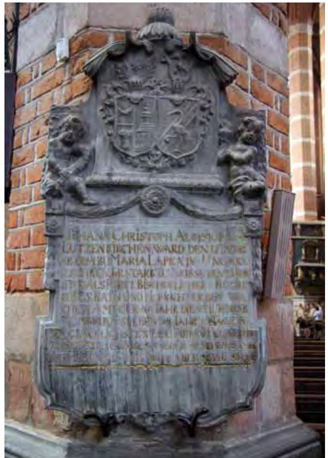
Fig. 6. Epitafium w katedrze w Nysie wykonane z marmuru sławniowickiego, fot. M. W. Lorenc • Epitaph made of the Plawniowice marble in the Nysa Cathedral, phot. M. W. Lorenc