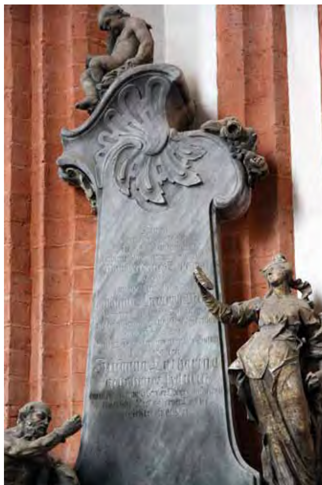
Fig. 15. Epitafium z marmuru Przeworno w bazylice św. Elżbiety we Wrocławiu • Przeworno marble epitaph in the Wrocław St. Elizabeth church

w tył, w polną drogę, która wiedzie już bezpośrednio do kamieniołomu. Do samego kamieniołomu nie dojedziemy samochodem, gdyż drogę zastawiono potężnym blokiem z piaskowca. Ostatnie 200 m pokonamy pieszo. Ta odmiana piaskowca z Gór Stołowych jest cenionym materiałem kwasoodpornym i ze względu na bardzo drobne uziarnienie była wykorzystywana także do produkcji tarcz szlifierskich.