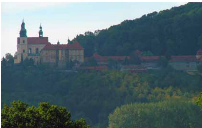
Fig. 2. Widok na klasztor w Kalwarii Zebrzydowskiej od strony wschodniej, fot. G. Krupa • A view at the monastery complex in Kalwaria Zebrzydowska from the east, phot. G. Krupa