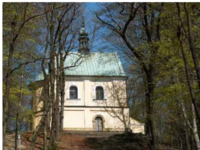
Fig.7 Kościół III Upadku • The Church of the Third Fall

Obiekty zbudowano na wzgórzu nazwanym Górą Moria. Do kaplicy prowadzi długi arkadowy przedsionek, wykonany niemal w całości z piaskowca („Gradusy”). Jedynie same stopnie, prowadzące wprost do Ratusza Piłata, wykonane są z granitu. Jest to budowla na rzucie wydłużonego prostokąta, sklepiona kolebkowo. Wejścia zwieńczone są półkolistymi obeliskami po bokach, z kolei przy narożnikach znajdują się stożkowe przypory. Po bokach elewacji w górnej części „Gradusów” są kamienne balustrady. „Gradusy” powstały na wzór Świętych Schodów prowadzących do bazyliki św. Jana na Lateranie. Z kolei Ratusz Piłata wzniesiony został na planie krzyża greckiego. Cokół stanowią płyty wykonane z piaskowca, którym została nadana faktura groszkowana. Ściany wykonano w technologii muru zasypowego, na zewnątrz obłożono okładką ciosową. Przestrzeń środkową nakrywa kopuła wsparta na pendentywach. Z czterech krótkich ramion krzyża, zamkniętych prostokątnie, trzy nakryte są sklepieniem krzyżowym, czwarte, od zachodu sklepieniem beczkowym (Szablowski, 1933).