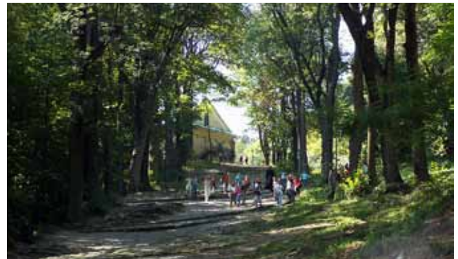
Fig. 3. Droga prowadząca od klasztoru do kościoła Ukrzyżowania • A path from the monastery to the Church of Crucifixion

Na przeciwległym stoku, a więc na północno-zachodnim zboczu góry Żarek, znajduje się dość duże odślonięcie warstw lgockich poziomu górnego. Jednak poza tymi dwoma efektownymi odślonieniami, bądź co bądź obszarami naruszonymi już przez człowieka, mamy także możliwość podziwiania innych, tym razem już czysto przyrodniczych osobliwości. Stoki góry Żarek pokryte są lasami chronionymi, a w ma-