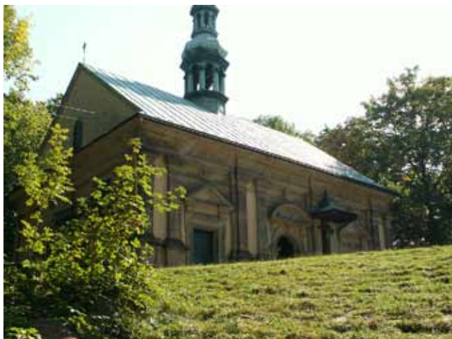
Fig. 6. Kościół Ukrzyżowania – widok od strony kaplicy Grobu Chrystusa • The Church of Crucifixion – a view from the side of the Chapel of Christ's Sepulchre

Tuż za kładką po lewej stronie drogi znajduje się niewielka kapliczka Cyreneusz. Wzniesiono ją na rzucie prostokąta i przykryto czterospadowym dachem. Na wszystkich czterech ścianach znajdują się arkady, zaopatrzone w żelazne kraty.