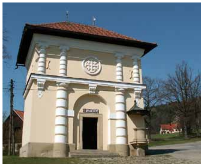
Fig. 8 Kaplica II Upadku tzw. Brama Zachodnia • The Chapel of the Second Fall: so-called Western Gate

Ze względu na dogodne położenie i dobre parametry złożowe, głównym źródłem materiału kamiennego był, znajdu-