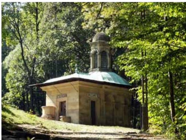
Fig. 5. Kaplica Grobu Chrystusa – widok od strony klasztoru • The Chapel of Christ’s Sepulchre – a view from the monastery side

Jest ona zwrócona frontem do wschodu i wzniesiona całkowicie z kamienia ciosowego. Projekt kaplicy był wzorowany na oryginalnej kaplicy Grobu Chrystusa, znajdującej się