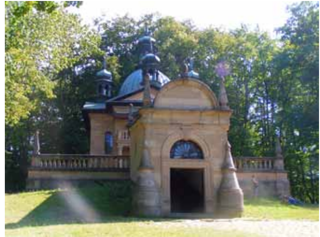
Fig. 10. Kaplica „Ratusz Piłata” z wyeksponowanym na pierwszym planie wejściem do Świętych Schodów – Gradusów • The „Pilate's Residence” chapel. The entrance to the Saint Stairs („Gradusy”) is exposed in the foreground

Not reaching Bugaj, after passing by the westernmost chapel, i.e., the "Hermitage of Mary Magdalene", there is a left-side branch of the main route that leads to the abandoned quarry named "Maria Magdalena" on the southern slope of Żarek Hill. There were once quarried the Lower Lgota sandstones applied to the construction of the most of sacral structures in Kalwaria Zebrzydowska. From the edge of the quarry wall a remarkable view opens to the southeast (Fig. 4). On the opposite, i.e., the northwestern slope of the Żarek Hill the-