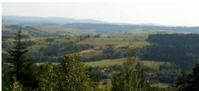
Fig. 4. Panorama wsi Bugaj ze szczytu góry Żarek tuż nad kamieniołomem „Maria Magdalena” • A view of Bugaj village from the top of the Żarek hill, directly up of the “Maria Magdalena” quarry

lowniczej scenerii gęstego lasu mieszanego oraz na jego obrzeżach możemy natrafić na rzadkie gatunki ściśle chronionych roślin, takich jak: barwinek pospolity, bluszcz pospolity, dziewięsił bezłodygowy, gółka ostrogowa, obuwik pospolity, skrzyp olbrzymi i wawrzynek wilczyłyko (Kowalik, 2004). Nic więc dziwnego, że rejon ten należy do korytarza ekologicznego o znaczeniu krajowym, który jest wpisany do mapy krajowego systemu ekologicznego ECONET.