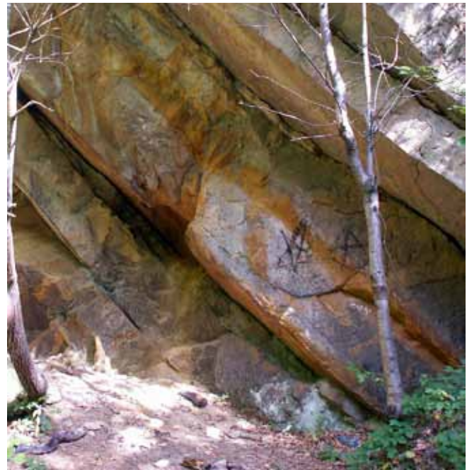
Fig. 11. Fragmenty wschodniej ściany wyrobiska piaskowców dolnoligockich „Maria Magdalena” • Fragments of the East wall of the Maria Magdalena quarry

re is a relatively large outcrop of the upper part of the Lgota Beds. Besides the two mentioned, attractive outcrops, being however only man-made sites, we can enjoy other, purely natural curiosities. The slopes of the Żarek Hill are covered with protected forest, and in a picturesque scenery of a dense, mixed wood and along its margins we can find rare, strictly protected plant species: periwinkle ( Vinca minor ), ivy ( Hedera helix L.), carline ( Carlina acaulis ), terrestrial orchid ( Gymnadenia conopsea ), lady's slipper ( Cypripedium ), horsetail ( Equisetum maximum ) and wild pepper – mezeron ( Daphne mezereum ) (Kowalik, 2004).