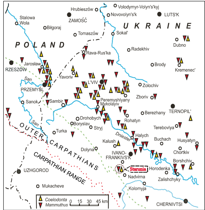
Fig. 3. Localities of mammoths and woolly rhinoceroses remains found in the Fore-Carpathian region. Map from the Archives of the State Museum of Natural History in Lviv • Lokalizacja miejsc odkryć szczątków mamutów i nosorożców włochatych na Przedgórzu Karpat. Mapa z Archiwum Państwowego Muzeum Przyrodniczego we Lwowie

The State Museum of Natural History of the NASU in Lviv is one of the oldest and the richest scientific collections in Europe. It was founded by count Włodzimierz Dzieduszycki (1825-1899), famous Polish zoologist, ethnographer and archaeologist (Fig. 1). He was a member of the Academy of Arts and Sciences in Kraków (since 1881), and spent a significant part of his fortune on purchasing the exhibits and supporting the museum (Brzęk, 1994). Dzieduszycki, who originated from one of the richest families in Galicia, was interested in science from childhood. He had been collecting specimens of fauna and flora for years, and kept them in Poturzyce (Potorytsya) palace situated about 80 km north of Lviv (Brzęk, 1994). At the end of the 1840s Dzieduszycki's zoological collection was enriched by paleontological and mineralogical collections of Professor Ludwik Zejszner from the Warsaw University, and by the herbarium of Professor Jan Łoborzew-