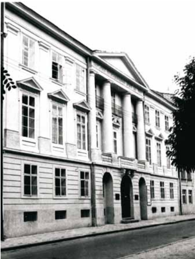
Fig. 2. Present state of the building of the State Museum of Natural History of the National Academy of Sciences of Ukraine (former Dzieduszycki's Family Museum) in Lviv. • Obecny stan budynku Państwowego Muzeum Przyrodniczego Narodowej Akademii Nauk Ukrainy we Lwowie (dawniej Muzeum Przyrodniczego im. Dzieduszyckich).

ski from the Lviv University and with some other specimens (Brzęk, 1994). Thus, a decision was made to find a building which could house such a magnificent collection. In 1854 a part of the collection was transported from Poturzyce to Lviv and housed in a building in Fredro Street, and in 1857 it was moved to Dzieduszycki's palace in 15 Kurkowa Street (recently Lysenka Street). As the collection was quickly growing, in 1868 Włodzimierz Dzieduszycki bought a building in 18 Teatralna Street, where the museum still exists (Fig. 2). After renovation of the building in 1869 the whole Dzieduszycki's collection was moved there. The building is a monument of architecture and has the technical marvel - the oldest lift in Europe, produced in Vienna in the middle of the 19th century. After arranging the exhibition in 1870, only several visitors could attend it. On 13th August, 1872 the museum introduced the Visitors' Book. Since 1873 the museum has been open for visitors once a week. Thus, the year 1870 is considered as the official date of its foundation when the exhibition was available for the public. During Włodzimierz Dzieduszycki's life the exhibition included 7 departments: zoological, paleontological, mineralogical, geological, botanical, archeological and ethnographical. At that time, many scientists were of the opinion that the scientific value of the Dzieduszycki's Family Museum is comparable to that of the London National Museum of the British Royal Society.