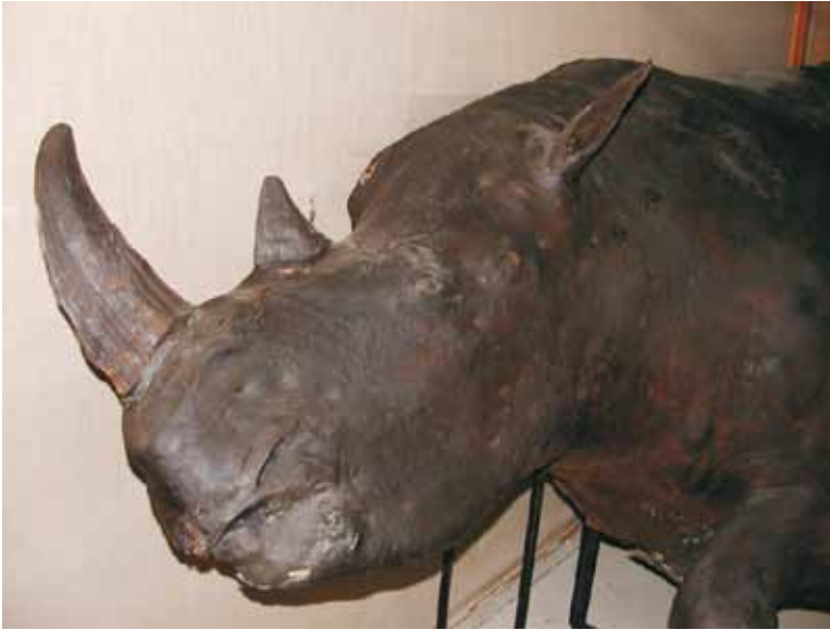
Fig. 5. Present state of the “first” rhinoceros from the State Museum of Natural History in Lviv. • Obecny stan „pierwszego” nosorożca w Muzeum Przyrodniczym Narodowej Akademii Nauk Ukrainy we Lwowie.

animals. These measures were not useless – at the beginning of November, 1907 miners found a partly preserved carcass at a depth of 17.6 m (5 m beneath the previous finding of mammoth). This was the so-called “first rhinoceros” of Starunia. The Rhinoceros (recently Coelodonta antiquitatis Blum., colloquially named “woolly rhinoceros”) was another extinct representative of Pleistocene fauna. The remains included the head covered with preserved skin, left ear, left fore leg, skin from the fore-part of left side and two horns (anterior and posterior). All excavated remains of this rhinoceros were also passed to the Dzieduszycki Family Museum, where they were conserved, mounted (Fig. 5) and exhibited in the Department of Paleontology together with the skeleton and the skin of mammoth. At the same time, apart from the mammoth and the woolly rhinoceros, the Museum acquired remains of other fossilized animals and plants. The precise age of plant and animal remnants found nearby the mammoth and the woolly rhinoceros is unknown. These probably belong to recent flora and fauna (Szafer, 1930; Granaszewski, 2002).