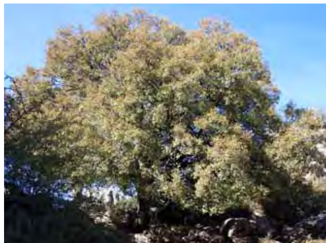
Fig. 5. Wyjątkowo duży okaz klonu ( Acer monpesellanum ), fot. M. Janusz • Extremely big maple ( Acer monpesellanum ), phot. M. Janusz