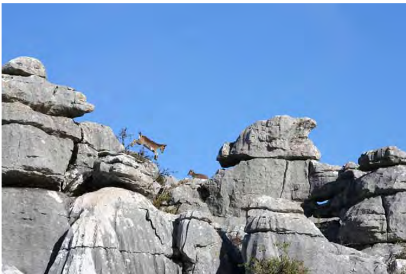
Fig. 6. Kozice na szczycie skał Torcal, fot. M. Janusz • Chamoises on the top of the Torcal rocks, phot. M. Janusz