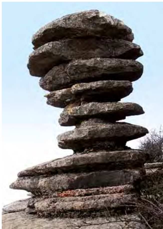
Fig. 12. Pomnik przyrody „Śruba”, fot. M.W. Lorenc • The Natural Monument ‘The Screw’, phot. M.W. Lorenc

Główną atrakcją tej trasy są oczywiście ciekawe formacje skalne, które w wyniku erozji przybierają niezwykle wręcz kształty.