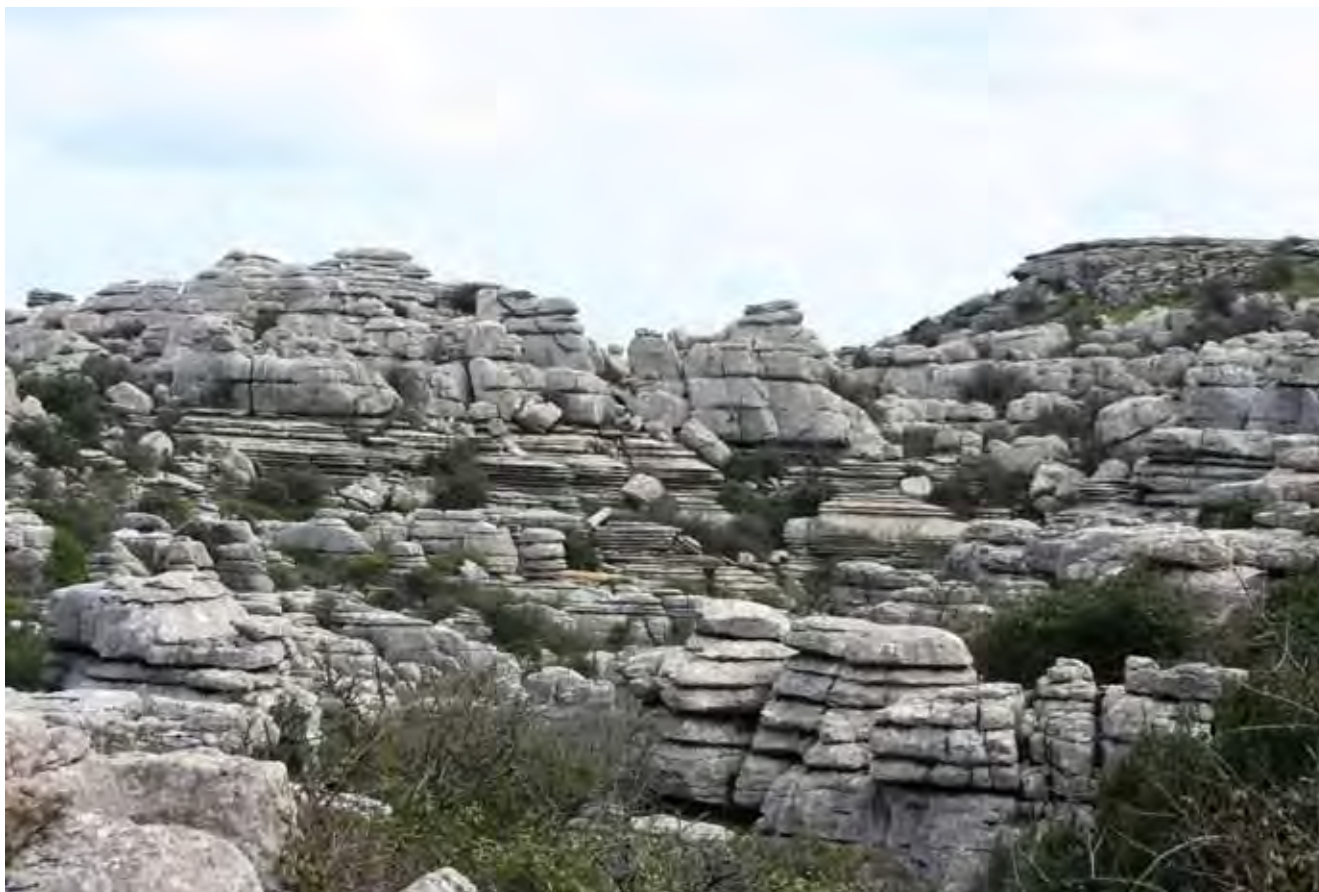
Fig. 2. Strefa wejściowa do Parku Naturalnego Torcal de Antequera, fot. M.W. Lorenc • Entrance zone of the Torcal de Antequera Natural Park, phot. M.W. Lorenc

Nic więc dziwnego, że nazwa „Torcal de Antequera” zwyczajowo rozumiana też jako „kamienne miasto” lub „kamienne piekło”, używana jest chyba raczej na przekór panującym tu warunkom pogodowym, które szczególnie w zimie odznaczają się wysoką wilgotnością i przyczyniają się do powstawania gęstej mgły, co z kolei przekłada się na wyjątkową, owianą tajemniczością atmosferę tego miejsca (Fig. 2).