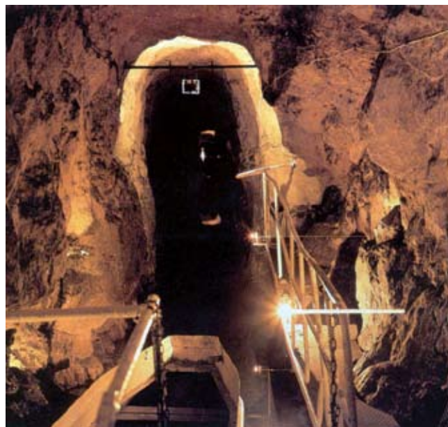
Fig. 4. Kopalnia Zabytkowa Rud Srebronośnych – fragment trasy turystycznej

nastowiecznej eksploatacji. W jej centralnej części stoją oryginalne wózki z XVIII wieku wypełnione urobkiem.