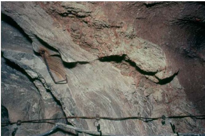
Fig. 6. Pogranicze pięter PZ3 i PZ4. Od prawej: strop zubru brunatnego (Na3t) ze strefą ilowca, który powstał z zubru w wyniku wyługowania soli, z widocznymi spękaniami błotnymi, sól podścielająca (Na4a0), anhydryt pegmatytowy (A4a1), najmłodsza sól kamienna (Na4a1) (odsłonięcie w kopalni „Solno”, Inowrocław)

Fig. 5. The borderline between PZ3/PZ4 units. From left: the roof of Brown Zuber (Na3t) with visible mud cracks covered by red halite created by the dissolution of the top parts of zuber, Underlying Halite (Na4a0), Pegmatite Anhydrite (A4a1) (“Solno” mine, Inowrocław)