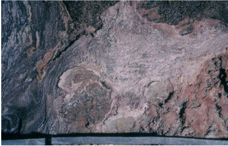
Fig. 7. Pogranicze piętra PZ3 i PZ4. Strzęp zmiążdżonej i porozrywanej tektonicznie soli podścielającej zawierającej obtoczone fragmenty iłowca ze stropu zubru brunatnego, kontaktujący się z anhydrytem pegmatytowym (od lewej), i z zubrem brunatnym (od prawej) (odsłonięcie w kopalni „Solno”, Inowrocław)