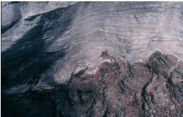
Fig. 4. Kontakt stropowej powierzchni zuberu brunatnego z solą podścielającą: widoczne spękania błotne i warstewka anhydrytu bezpośrednio na stopie zuberu (odsłonięcie w kopalni „Solno”, Inowrocław)

Fig. 3. The borderline between PZ3/PZ4 units exposed in the „Solno” mine, Inowrocław. From right: the roof of the Brown Zuber (Na3t) with visible mud cracks, Underlying Halite (Na4a0), Pegmatite Anhydrite (A4a1), Youngest Halite (Na4a1)