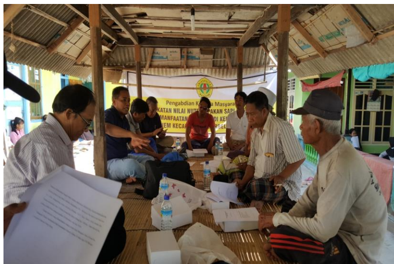
Gambar 1. Anggota Kelompok Tani Ternak Pade Genem mengikuti Penyuluhan

Adapun materi pengabdian disampaikan oleh masing-masing anggota tim, kemudian setelah semua pemateri selesai menyampaikan paparannya, dilanjutkan dengan diskusi/Tanya jawab. Para peserta sangat antusias mengikuti penyuluhan serta mempunyai kemampuan memadai untuk memahami materi penyuluhan, terbukti dari pertanyaan yang mereka sampaikan (Gambar 1).