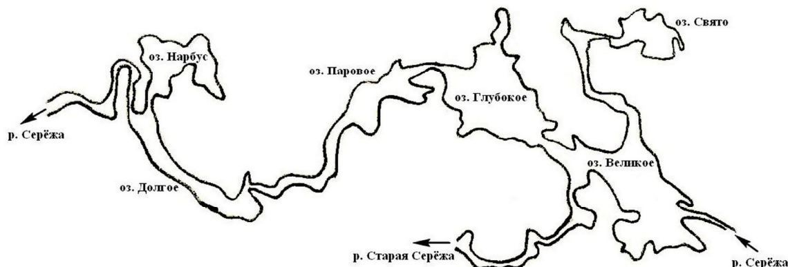
Рис. 2. Схема Пустынского озерно-речного комплекса

APG IV и др. по ранее предложенной схеме (Garin, 2016). Внутри семейств таксоны расположены в алфавитном порядке.