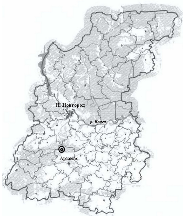
Рис. 1. Карта Нижегородской области: точкой обозначено место нахождения Пустынского озерно-речного комплекса

Государственный природный заказник регионального значения «Пустынский» площадью 19 730 га, образованный постановлением правительства Нижегородской области от 16 сентября 2013 г. № 651 «О реорганизации особо охраняемых природных территорий», расположен в Теше-Сережинском карстовом районе Окско-Сурской карстовой области (Stupishin, 1967) или Суреже-Пьянском карстовом озерном районе (Stankov, 1951) области. Его создание было обосновано необходимостью охраны редких видов живых организмов, разнообразных типов растительности, уникальных ландшафтов (в том числе карстовых форм рельефа – провалы, воронки, пещеры, карстовые озера) и фитоценозов, сосредоточенных на данной территории (рис. 1).