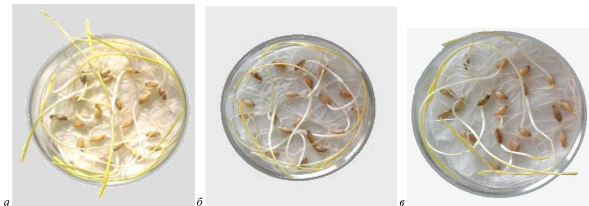
Рис. 1. Вплив культуральних рідин мікроміцетів-антагоністів на проростання насіння ярого ячменю: обробка культуральною рідиною T. longibrachiatum 17 (а) та T. lignorum 14 (б) не пригнічувала ріст і розвиток проростків порівняно з контролем (в); кількість пророслого насіння після обробки T. longibrachiatum 17 була більшою, ніж у контролі

Оцінюючи потенціал мікробів-антагоністів фітопатогенів, слід враховувати вплив їх метаболітів на ріст і розвиток рослин. Із цією метою визначають фітотоксичність культуральних рідин цих мікроорганізмів. Нами досліджено вплив найактивніших штамів мікроміцетів T. longibrachiatum 17 та T. lignorum 14 на ростові показники ярого ячменю сорту «Кристалія». Порівнювали довжину коренів і листків у проростків насіння, обробленого культуральними рідинами мікроміцетів у розведенні 1 : 10, з морфометричними показниками контрольних проростків, оброблених стерильною водою. За даними Horshchar (2013) токсичними вважають культури, які пригнічують ріст пагонів і коренів на 30% і більше порівняно з контролем.