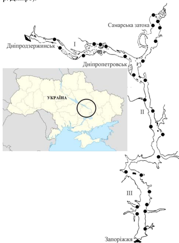
Рис. 1. Місця відбору іхтіологічних проб на Дніпровському водосховищі: верхня (I), середня (II) та нижня (III) ділянки; ● – станції відбору

Відбирали іхтіологічні проби в літній період 2008–2010 рр. на всій акваторії Дніпровського (Запорізького) водосховища (рис. 1), а 2012 року – на його верхній ділянці в межах природного заповідника «Дніпровсько-Орільський» (за відповідним дозволом на вилучення біоматеріалу), на р. Інгулець (права притока р. Дніпро), гирловій частині р. Самара Дніпровська (ліва притока р. Дніпро).