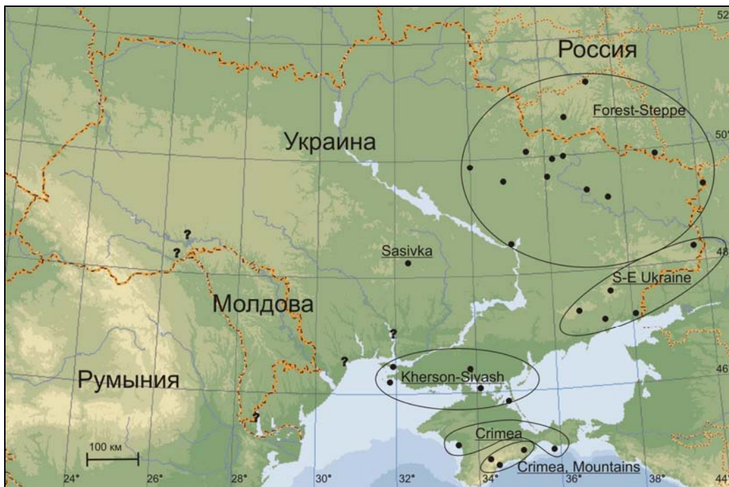
Рис. 1. Географическое положение изученных выборок V. renardi