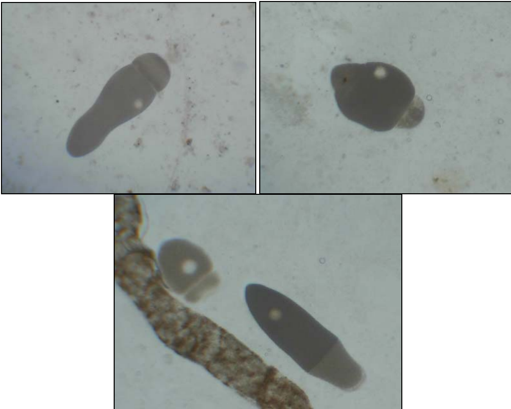
Рис. 2. Грегарини у кишечнику Pterostichus melanarius (III.)

При дослідженні кишечників P. melanarius (III.) виявили одноклітинних паразитів (рис. 2). Ці найпростіші належать до класу споровиків (Sporozoea), ряду грегарин (Gregarinida), підряду справжніх грегарин (Eugregarinina), триби цефалін (Cephalina).