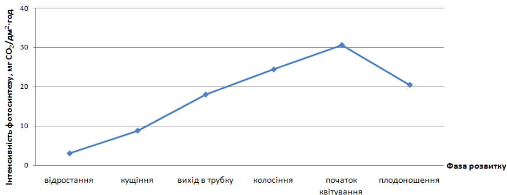
Рис. 2. Динаміка інтенсивності фотосинтезу Elytrigia repens L. на вивчених луках