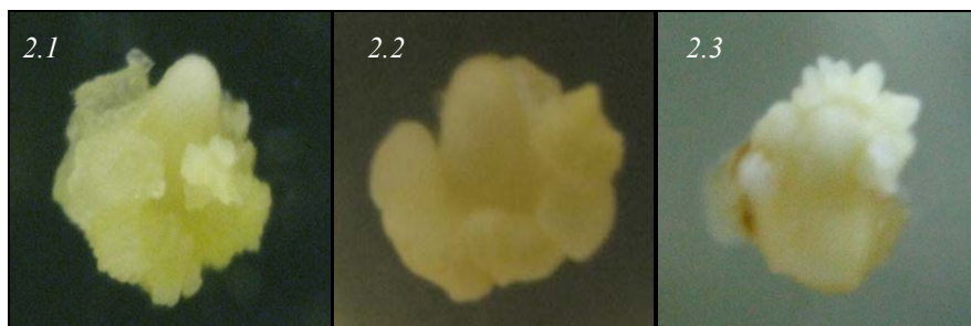
Рис. 2. Зовнішній вигляд калусів ліній кукурудзи підплазми Mo17/Oh43 плазми Ланкастер і лінії підплазми Chi31 екзотичної плазми на 30-ту добу культивування:

Калуси лінії ДК633/266 (рис. 2.1) великі, світло-жовтого кольору, утворюються як під щитком, так і на ньому. У цієї лінії переважає калус типу II, хоча відмічається й калус типу I із добре помітними ембріодними структурами, деякі калуси у зазначений період культивування спонтанно переходять до регенерації. Калуси лінії ДК298 (рис. 2.2) середнього розміру порівняно з калусами інших ліній мають світло-жовте забарвлення, відмічено ембріодні структури. Лінія Chi31 (рис. 2.3) переважно утворювала світло-жовті, великі калуси типу II та окремі калуси типу I середнього розміру.