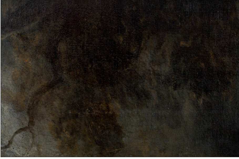
II. VII. Jan Lievens (?), Portret młodzieńca , fragment pejzażu w tle