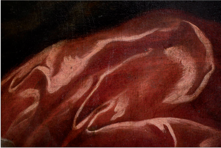
II. VI. Jan Lievens (?), Portret młodzieńca , detale