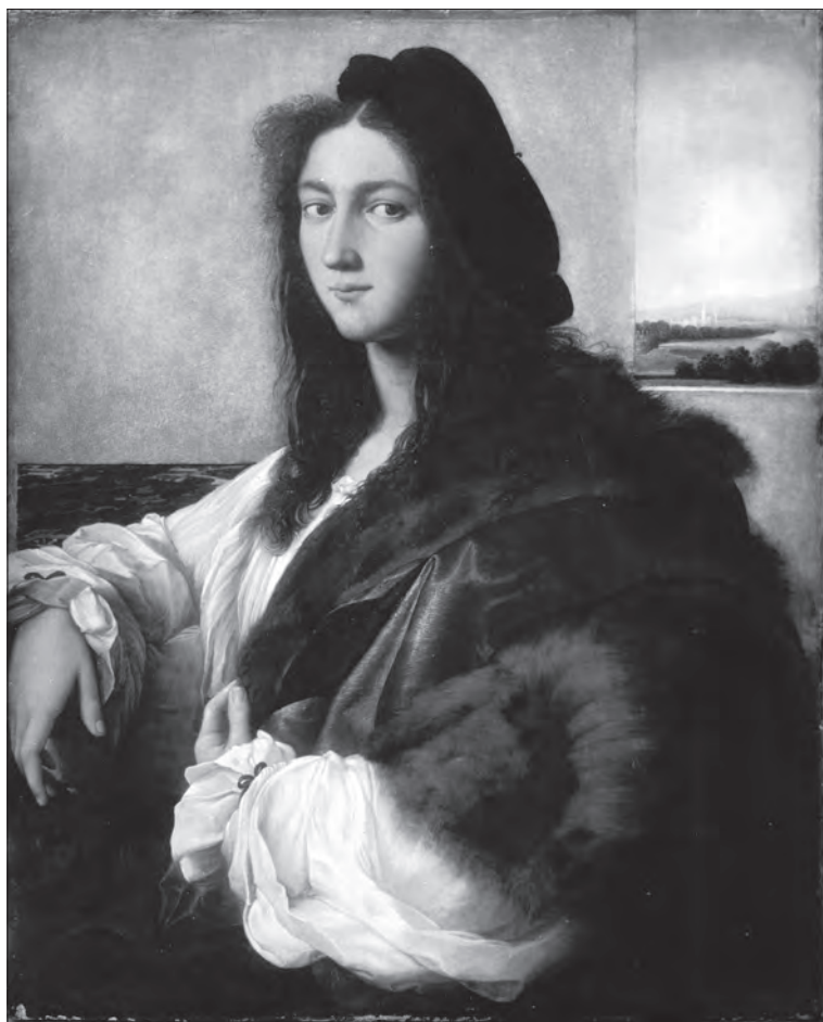
Il. 1. Rafael, Portret młodzieńca , zaginiony, dawniej Muzeum XX. Czartoryskich w Krakowie. Przedruk za: J. Wałek, Rafała „Portret młodzieńca” ze zbiorów Czartoryskich , Rozprawy Muzeum Narodowego w Krakowie, Seria Nowa, t. 1, Kraków 1999

XIX i XX wieku uznała za geniusza. Przydawało obrazowi splendoru także to, że wzorem dlań był obraz innego spośród geniuszy – Rafała, malarza najwyżej cenionego przez cały XIX wiek. Autorstwo Rafała w odniesieniu do obrazu z kolekcji Czartoryskich było przez niektórych badaczy kwestionowane – wątpliwości mieli m.in. tacy znawcy malarstwa włoskiego, jak Joseph A. Crowe i Giovanni Cavalcaselle oraz Bernard Berenson, który przypisywał go Sebastianowi del Piombo 5 . Do poglądów kwestionujących autor-