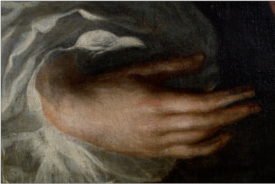
II. IV-V. Jan Lievens (?), Portrait młodzieńca , detale