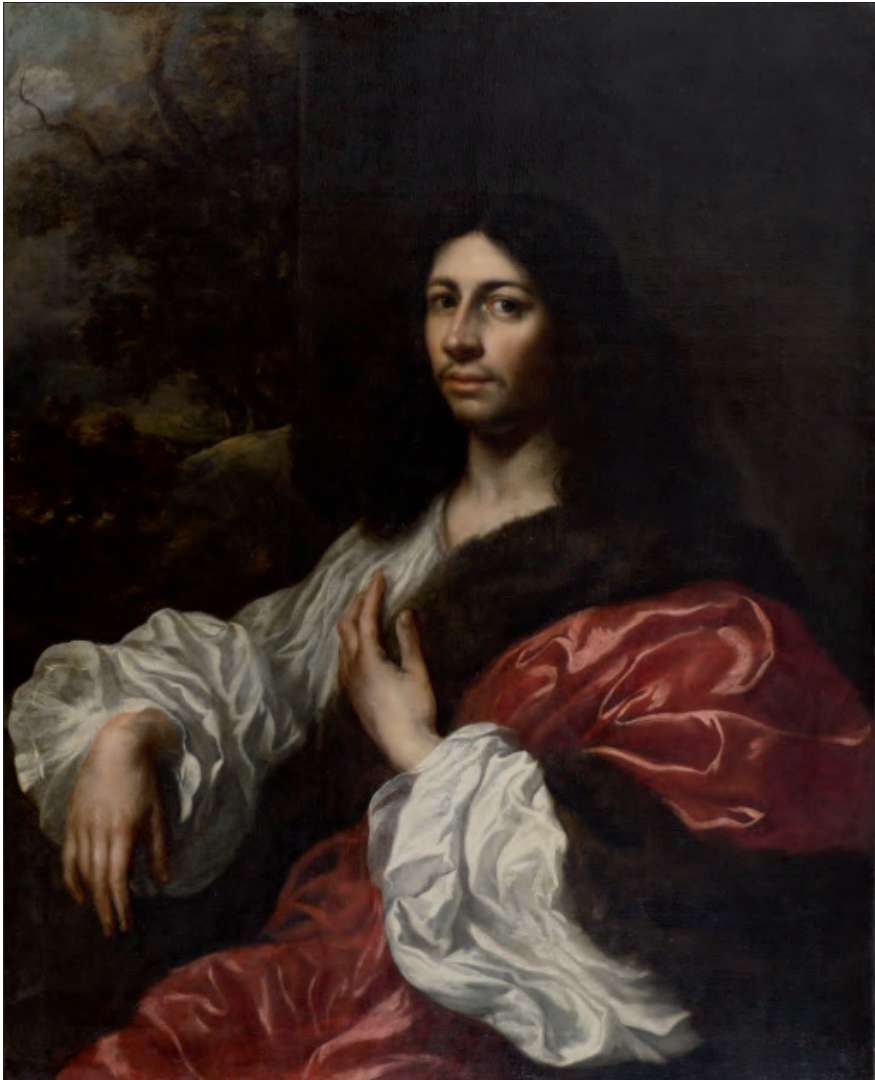
Il. I. Jan Lievens (?), Portret młodzieńca , Zamek Królewski na Wawelu