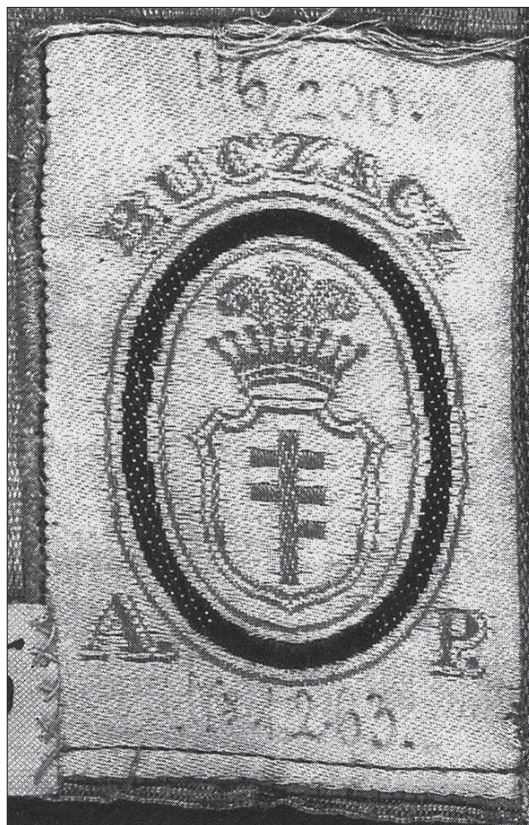
Il. 4. Metryczka buc Zackiej tkalni Artura Potockiego, z makaty w zbiorach Muzeum Narodowego w Warszawie, fot. wg: J. Chruszczyńska, Makaty buc Zackie w zbiorach Muzeum Narodowego w Warszawie , Warszawa 1996, s. 10