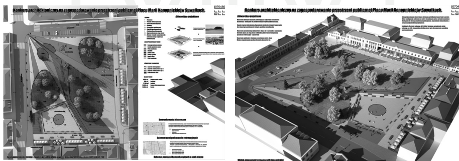
Ill. 3-4. The winning concept of organising the area of Maria Konopnicka Square, chosen by the inhabitants and the Mayor of Suwałki