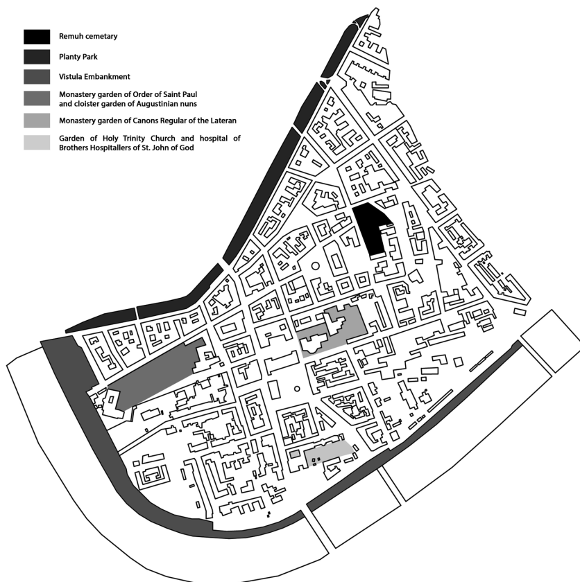
III. 1. Location of green areas in the old Kazimierz district (edited by J. Klimek)