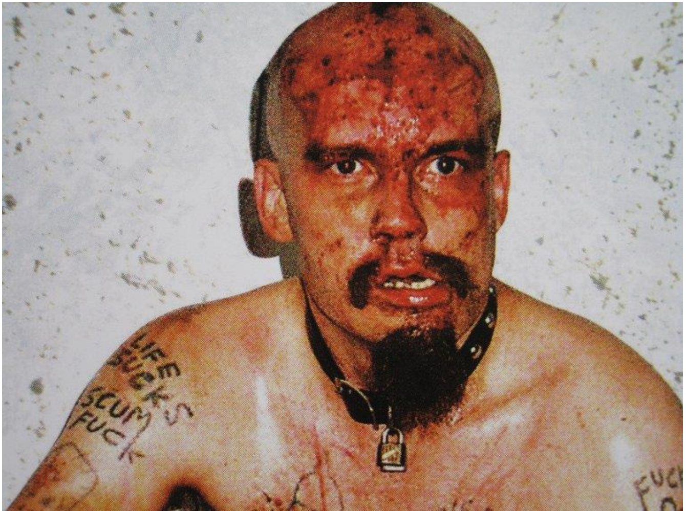
(G. G. Allin,)

Allin blev kendt for en ekstreme sceneoptræden, hvor han onanerede på scenen og smurte lort og blod ud over sig selv og publikum. Allin forstod sig selv som en dødsforagtende rock'n'roll-terrorist, der ville ryste det borgerlige samfund. En slags punk-anti-krist. Han ville gøre rockmusikken farlig igen. Rock'n'roll skulle være et oprør, der kunne forstyrre samfundet.