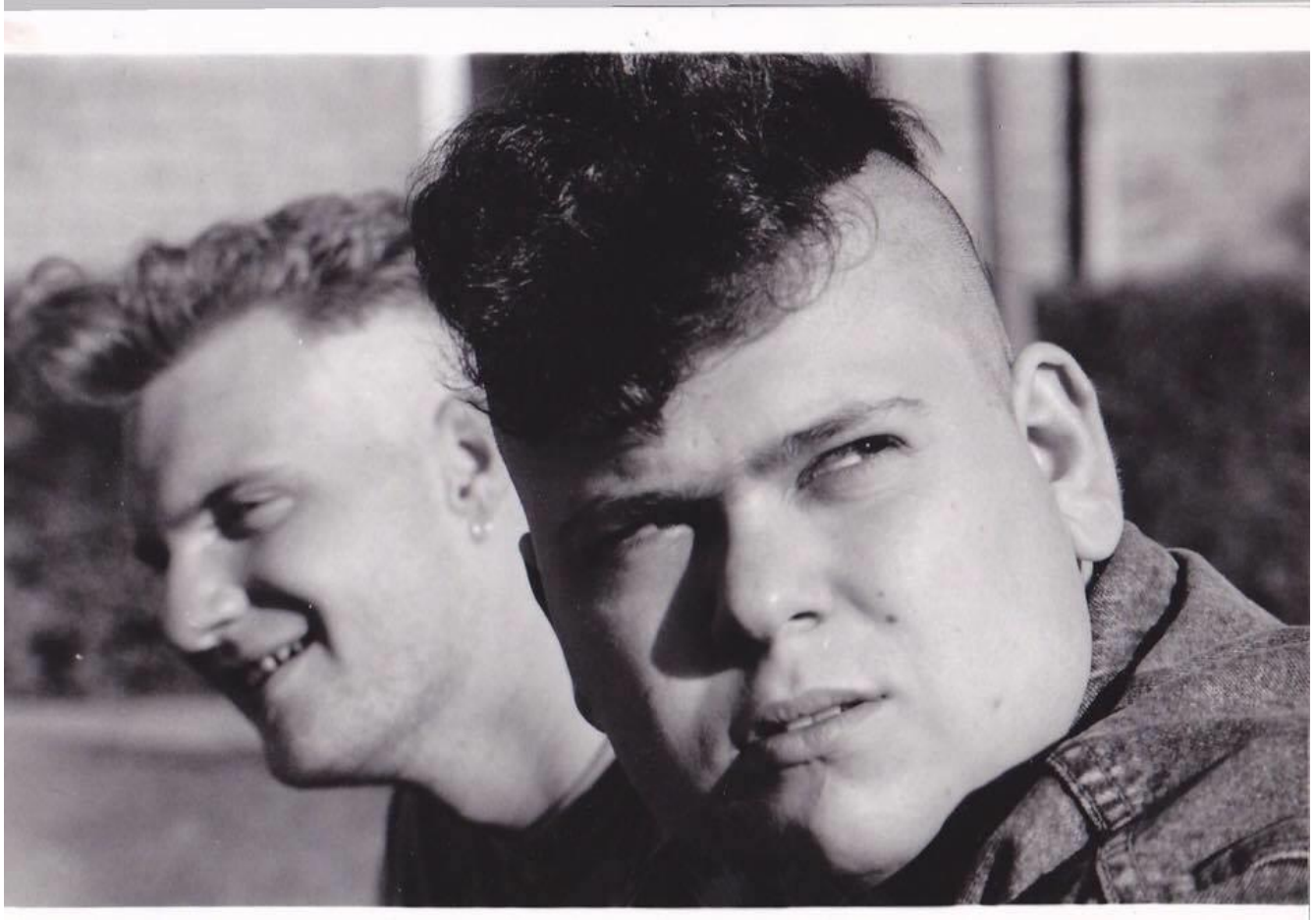
Fynshav, 1992. Forfatteren er bagerst på billedet.