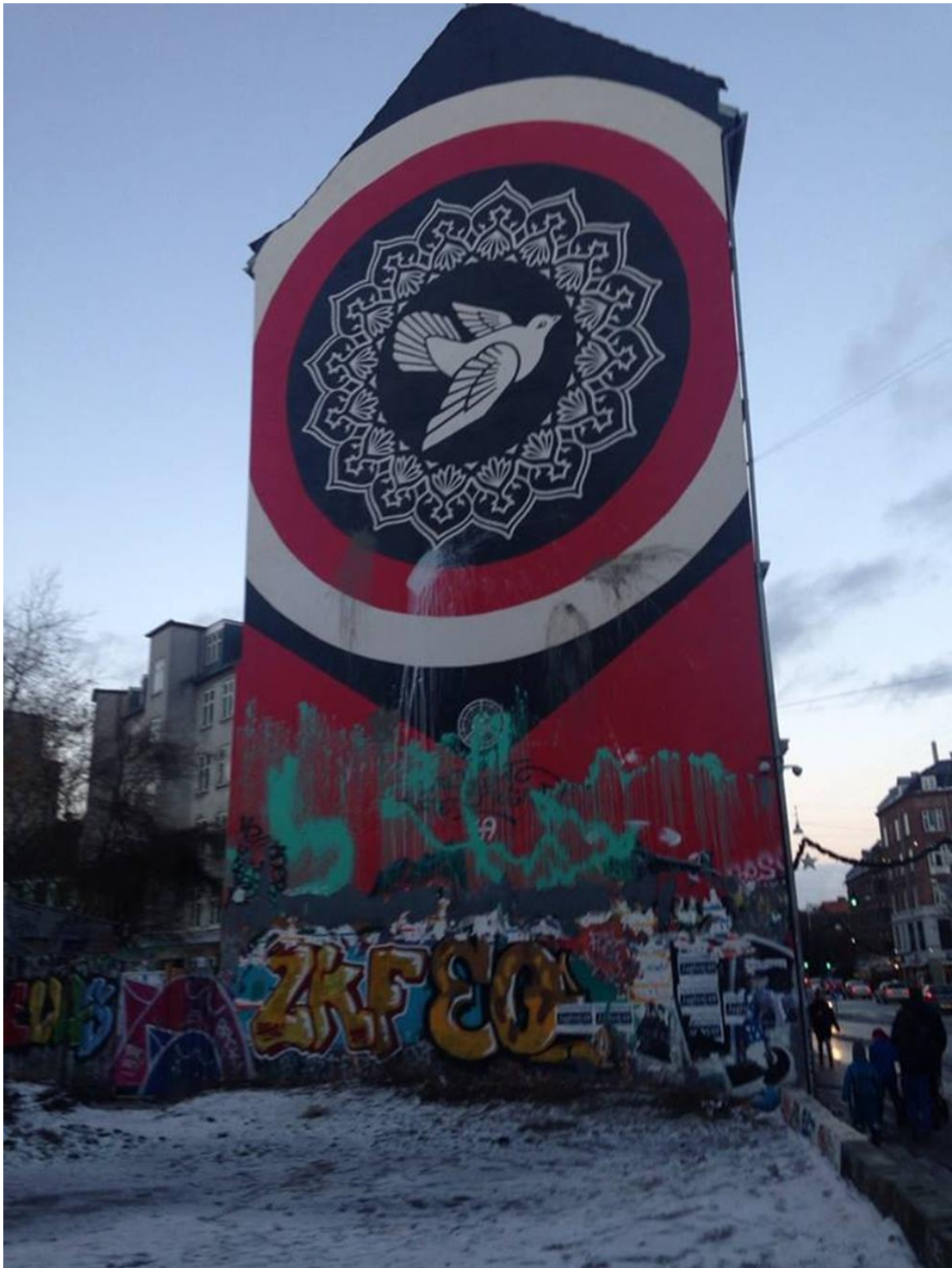
Jagtvej 69, 2015, Foto: Anders Dræby