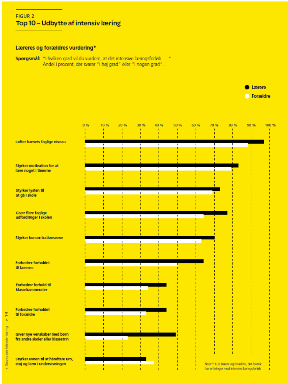
Figur 1.1: Udbytte af intensiv læring

(Egmont Rapporten 2015, Intensive Læringsforløb, s. 14)