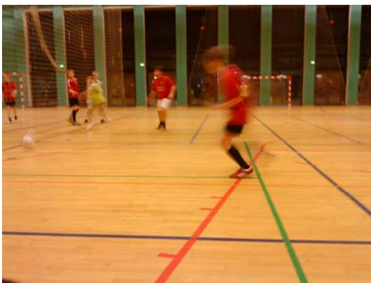
Foto af fodboldtræning i klubben Vestia der om vinteren træner i DGI-byen (om sommeren i Bavnehøj).