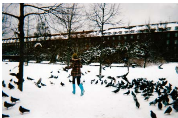
Foto 26 og foto 27: Ans foto af Enghaveparken, hvor hun kommer med familien om søndagen for at se på fugle og spille fodbold med sin lillebror.

(Foto: An, pige på 12 år, ES, familieinterview, 30-01-2010)